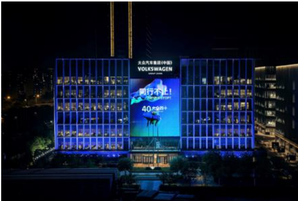
V Číně podíl VW na trhu prudce klesá. Nyní chce firma zřejmě zavřít další závod v této zemi. (Symbolická fotografie)

Kvůli špatnému využití kapacity by mohl VW prodat více ze svých 26 čínských závodů na výrobu automobilů, uvádí Wirtschaftswoche . Mohly by to být továrny, kde se vyrábí modely Škoda, protože prodeje značky jsou na volném propadu. Zatímco před koronavirovou krizí se v Číně prodalo více než 300 000 škodovek, letos už jen kolem 11 000.