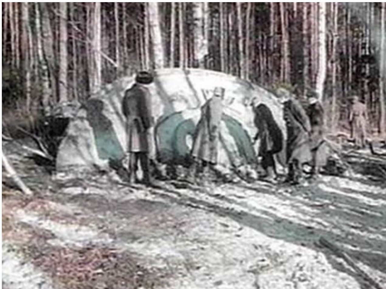
Létající talíř nalezený v Rusku

Podle ruského listu Pravda měla KGB speciální jednotku, která studovala mystické a nevysvětlitelné jevy uvnitř i vně země.