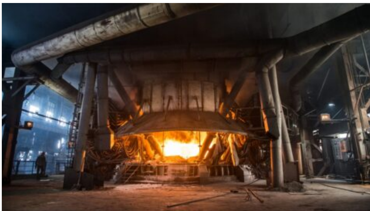
Ocelářský kolos ArcelorMittal odkládá rozhodnutí o zelených investicích. Vodík i plyn jsou pro něj příliš drahé