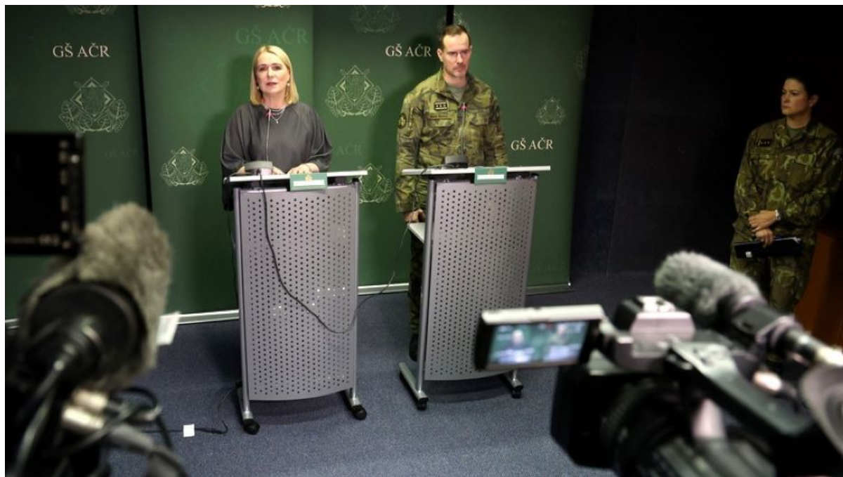
Náčelník Generálního štábu Armády ČR a ministryně obrany Jana Černochová.