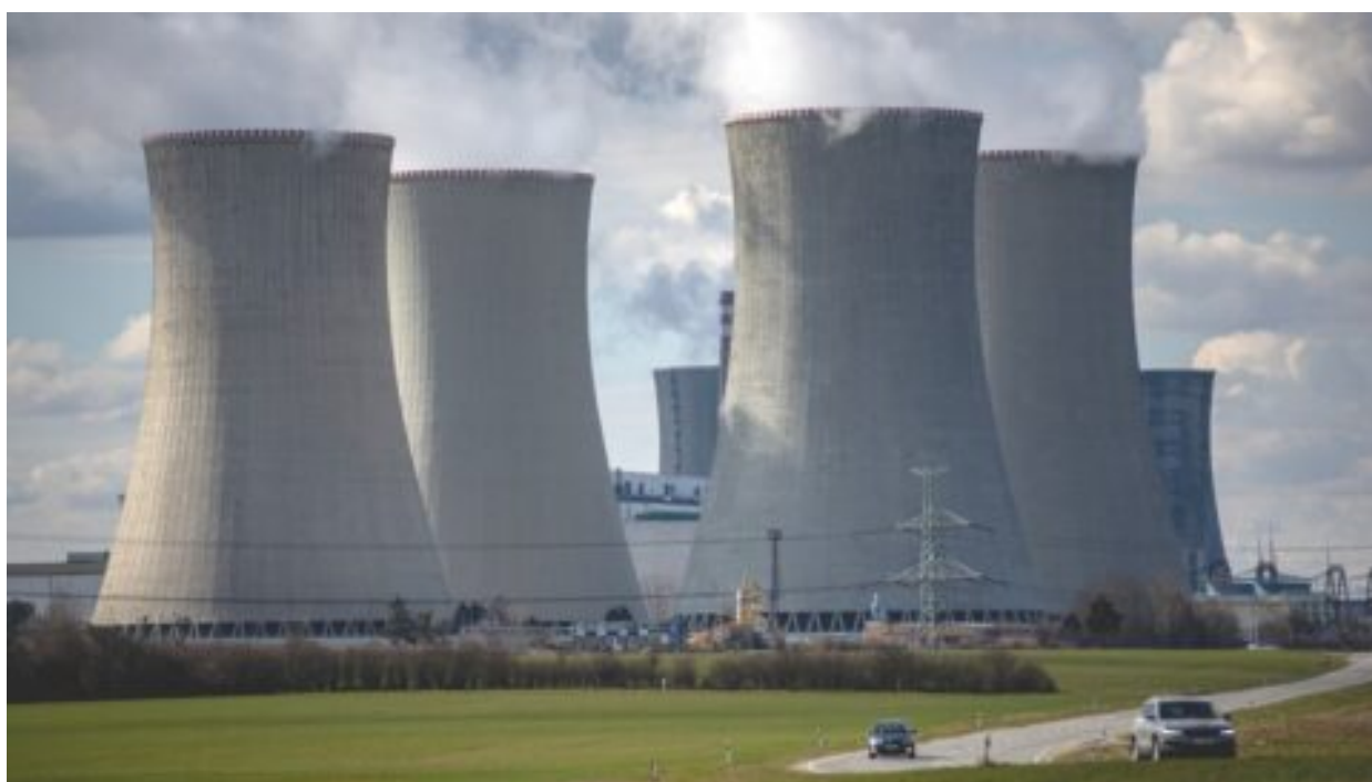
Stavba Dukovan je obrovskou příležitostí pro české firmy, problém mohou být lidé