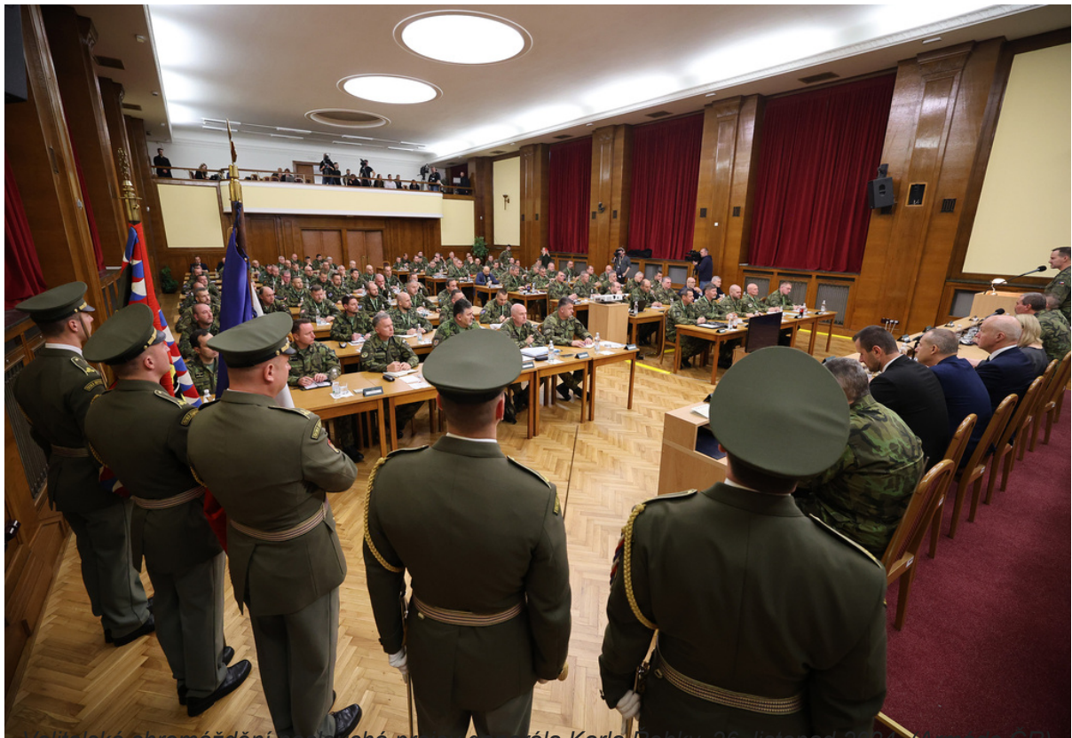
Velitelské shromáždění poslouchá projev generála Karla Kenky, 26. listopad 2024.

Ministryně obrany Jana Černochová (ODS) následně po Řehkovi prohlásila : „Víme, že přicházíme o zkušené lidi, kdy odchází ze služebního poměru více vojáků na základě vlastní demotivace než na základě rozhodnutí nadřízených.“ To se podle ní také negativně projevuje i na „nezbytném doplňování zálohy“.