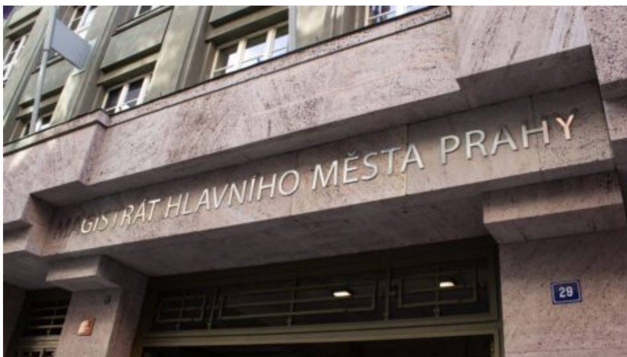
Přes 850 000 Kč pro asistentku. Praha Sobě požaduje odvolání šéfa magistrátu