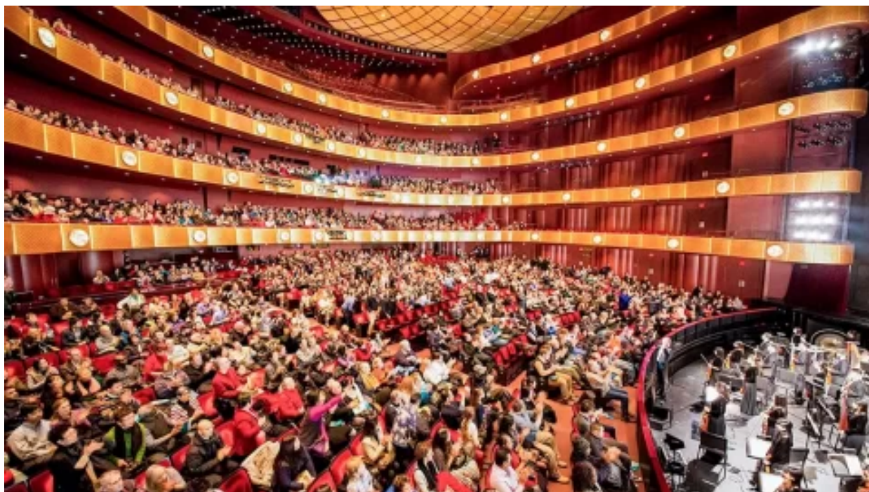
Informátor z čínské komunistické strany označuje za hlavního organizátora útoků na umělecký soubor Shen Yun vysokého čínského představitele