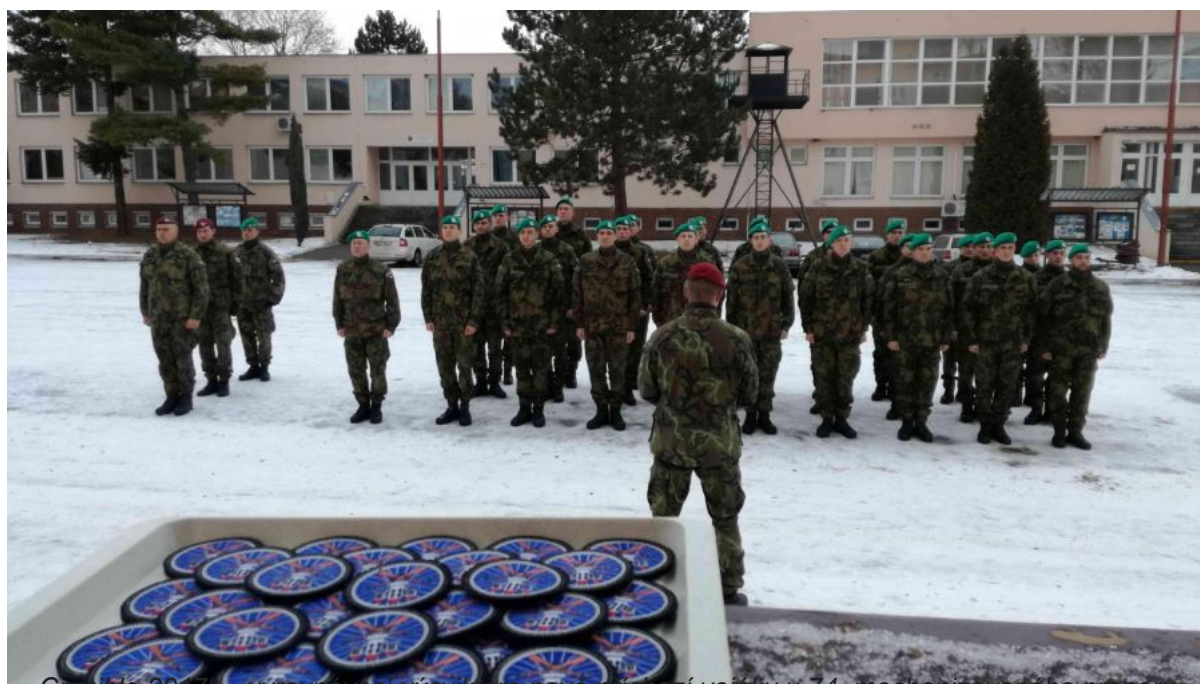
„Crucible 2017 – vyrovnávací výcvik ORP 74. mechanizovaného praporu (Armáda ČR 74. mechanizovaný prapor) mechanizovaného praporu.“

Redakce požádala vedení 74. mechanizovaného praporu a velení armády o komentář.