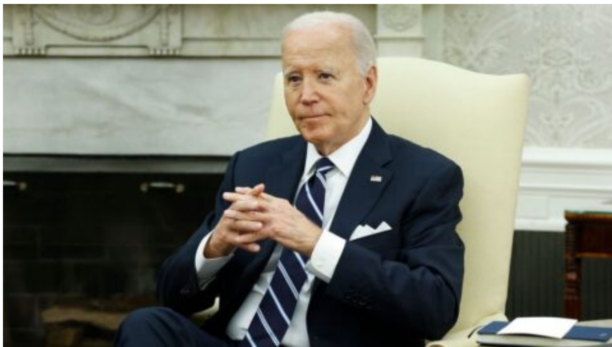
Dosluhující americký prezident Biden omilostnil svého syna Huntera