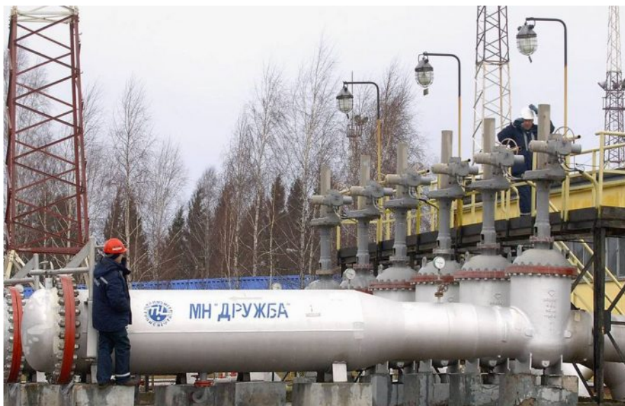
Přečerpávací stanice ropovodu Družba

Sázkou na jistotu je 27 zemí EU, které se díky válce s Ruskem odpojily od laciných ruských energií, nejen plynu, ale i ropy, což před pár dny úmyslně provedla vláda Petra Fialy, která odmítla, na rozdíl od Maďarska a Slovenska, uzavřít s Ázerbájdžánem anebo s Tureckem tzv. swapové dohody o nákupech turecké a ázerbájdžánské ropy výměnou za swapové dodávky ruské ropy pro tyto dvě země. Situace vznikla kvůli uvalení ukrajinských sankcí proti ruskému Lukoilu, které zamezují přímým dodávkám od ruských producentů, aby prý nedocházelo k financování Putinovy války na Ukrajině ze zdrojů evropských odběratelů ropy.