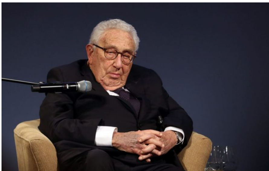
Henry Kissinger byl hlavním autorem vzniku petrodolaru v roce 1974

A právě vyhození plynovodů Nord Stream mezi Německem a Ruskem do povětří v létě 2022 a obrovské sankce a izolace Ruska měly vytvořit pro amerického národního prediktora náhradní podkladové aktivum v Evropě pro petrodolar – obchod se zkapalněným plynem. Celá Evropa nyní nakupuje od FEDu v houfech a zástupech americké dolary a spolu s nimi americké státní dluhopisy, stejně jako to dělaly 50 let země světa při nákupech arabské ropy.