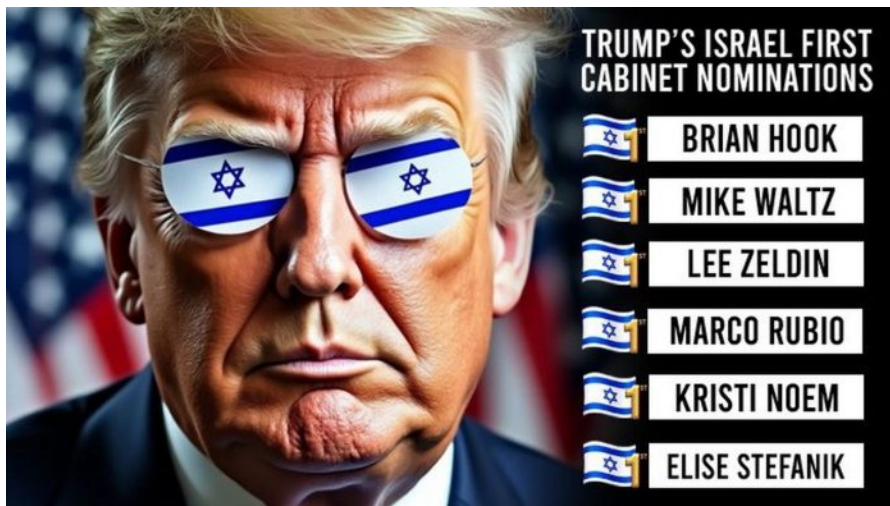
Trumpova politika bude silně pro-izraelská a současně silně proti-čínská

V zásadě je prý třeba, aby ve světě bylo více zásad a méně pokrytectví. Americká státní moc je existenčně závislá na funkci a přežití petrodolaru jako světové rezervní měny č. 1. Jenom díky ropě a fosilním palivům, jako je ropa, ale v poslední době stále více zkapalněný plyn (LNG), kterým USA chtějí postupně nahradit ropu od nespolehlivé Saúdské Arábie, která zradila Kissingerovské dohody s USA o exkluzivitě prodeju arabské ropy výhradně za americký dolar, zůstávají USA ještě stále v platební schopnosti.