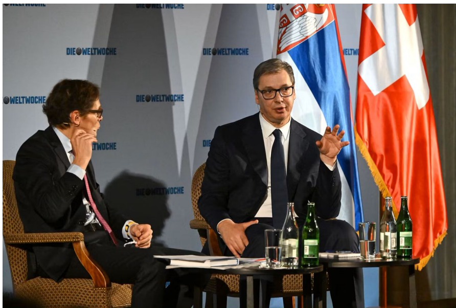
Aleksandar Vučić v Curychu

Demonstrace rakety Orešnik prý v NATO byla pochopena jako známka strachu a slabosti Valdimira Putina k úderům proti NATO. Za dopady amerických raket byla potrestána Ukrajina a závod Južmaš v Dněpropetrovsku, nikoliv polské navigační centrum Řešov, odkud jsou americké rakety ATACMS programovány a letově korigovány na cíle v Kurské oblasti. Jak uvedl [1] samotný deník, na pozvání Weltwoche navštívil ve středu 4. prosince Curych Alexandar Vučić, od roku 2017 prezident Srbské republiky. Na vyprodané akci v Dolder Grand Hotelu nejprve přednesl “curyšský projev” a poté odpovídal na otázky šéfredaktora Rogera Köppela, který jej označil za “muže míru” .