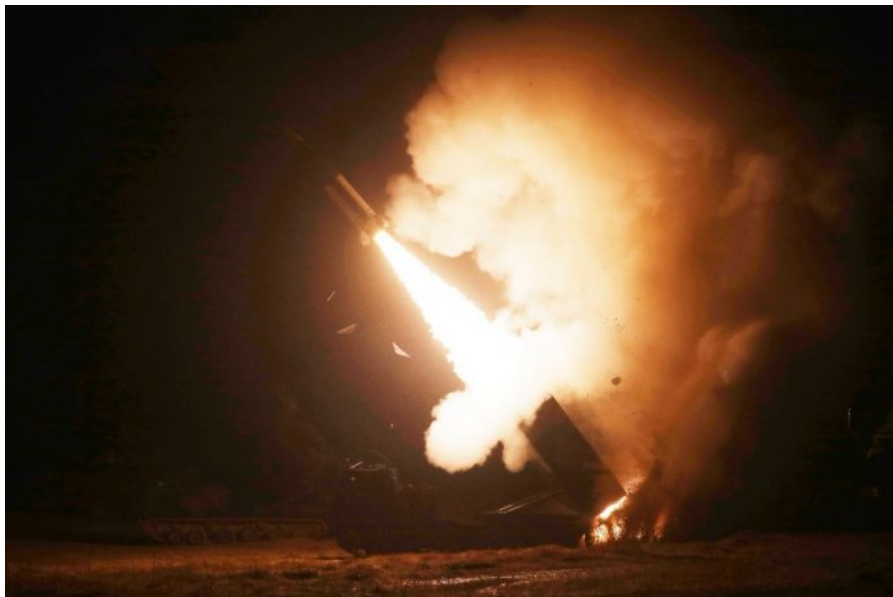
Palba amerických raket proti cílům v Rusku za použití komplexu Himars

Přesto ale platí, že v době války ministři zahraničí mají jen slabé slovo a kolektivní Západ (KoZa) čelí strategické porážce v této válce okolo Ukrajiny. Nemá ani smysl říkat “ na Ukrajině “, protože ta válka je zástupná a vede se facto okolo Ukrajiny, okolo procesů napojených na Ukrajinu, okolo role odepisovaného petrodolaru, okolo role demise USA jako světové unipolární velmoci.