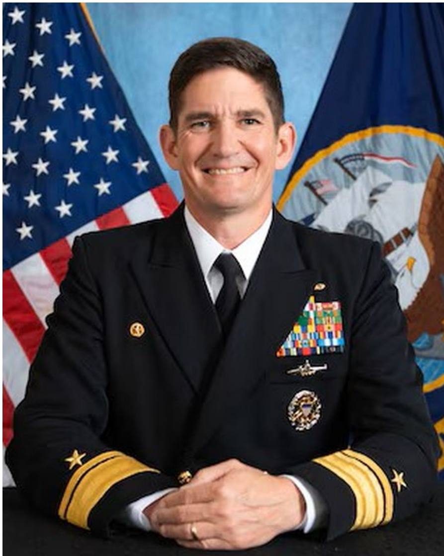
Vrchní admirál Thomas Buchanan

Vrchní admirál Thomas Buchanan, ředitel plánů a politiky Strategického velitelství Ministerstva obrany Spojených států (STRATCOM), při svém projevu na akci Projekt Atom 2024 v Centru pro strategická a mezinárodní studia, 20. listopadu 2024, uvedl, že Spojené státy by povolily jadernou výměnu, pokud by její výsledek byl za podmínek, které označil za “přijatelné” pro zemi a její zájmy . To znamená, pokračoval Buchanan, že Spojené státy by po takové výměně “nadále vedly svět”.