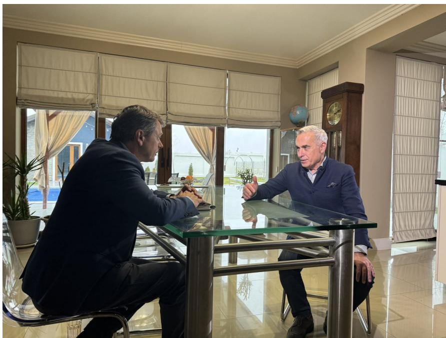
Calin Georgescu v rozhovoru pro Sky News

Ta doslova požírá národ spolu s tím, jak si válka žádá další a další oběti. A za to válka poskytuje další a další práci, objednávky se navyšují, válečný průmysl praská ve švec. Je třeba si uvědomit, že západní ekonomiky se z covidové pandemie dodnes nedostaly. Recese ovládla celou Evropskou unii a nejlepším důkazem je německý průmysl a to, co se tady v Německu děje.