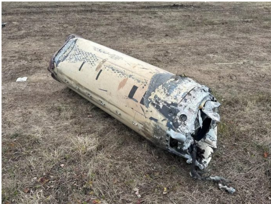
Fragment sestřelené rakety ATACMS na poli u Taganrogu

Přesto několik vojáků strážících letiště prý bylo zraněno šrapnely po výbuchu hlavice sestřelené rakety. Celé se to redukuje pouze na otázku, kdo bude mít pevnější nervy a vůli. Jestli je v sázce opravdu tolik, kolik se zdá, že neoconi a západní silovíky se nezdráhají dokonce v Rumunsku zastavit volby poté, co voliči již odevzdali hlasy v 1. kole, tak je jasné, že tady jde veškerá legrace už stranou.