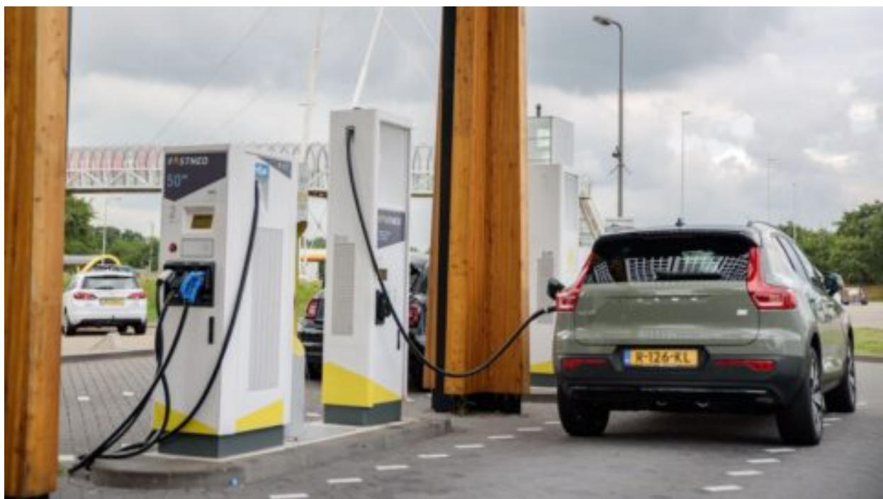
ČR s Itálií vyzvou EU, aby automobilky sankce za málo elektromobilů pro příští rok neplatily