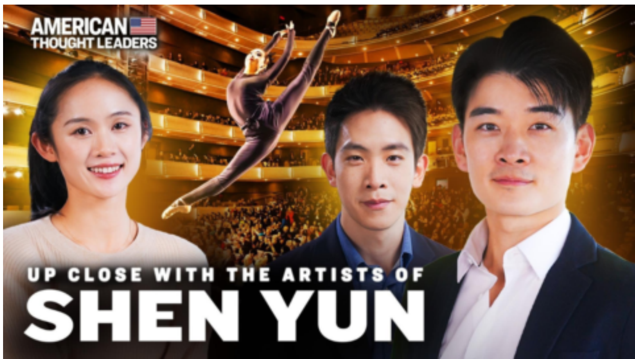
Shen Yun Performing Arts – proč je americký tanečně-hudební soubor tak úspěšný a zároveň trnem v oku Pekingu