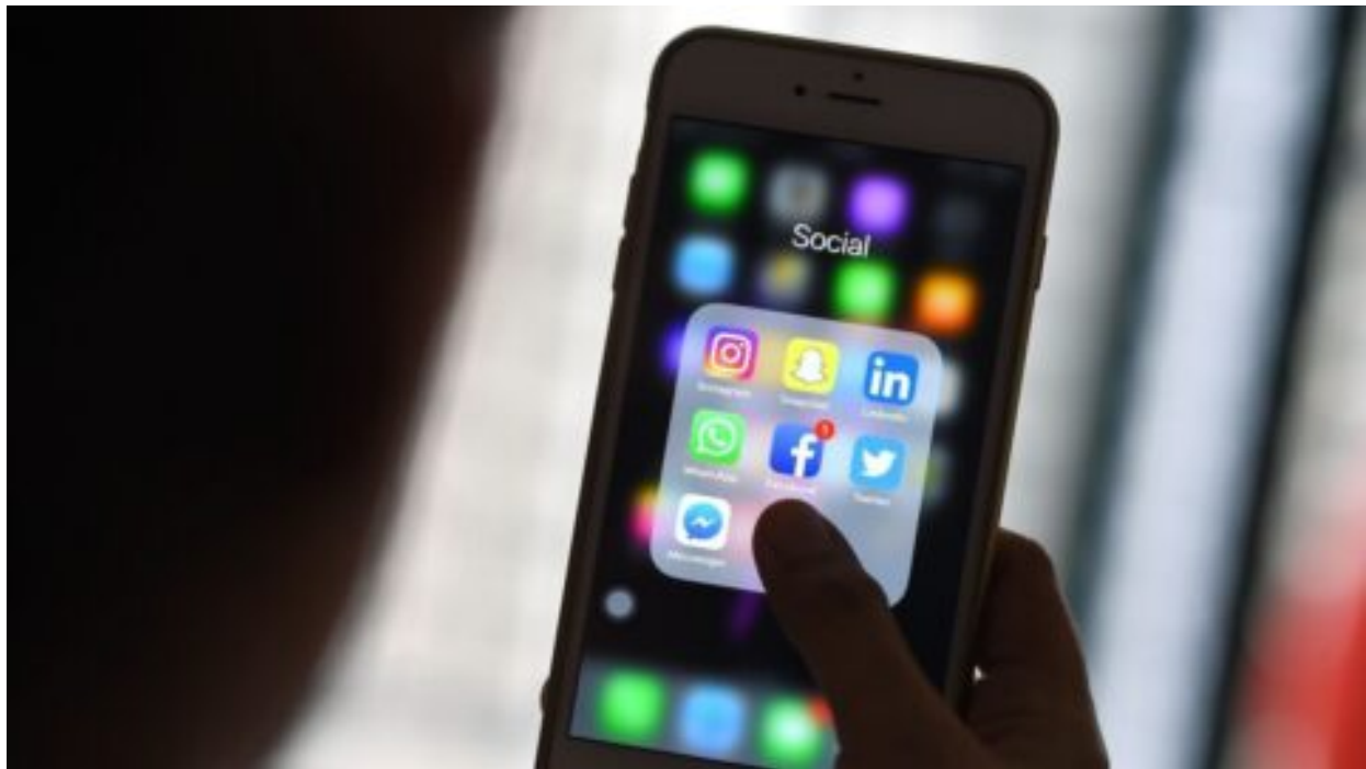
Záření z mobilních telefonů: První studie na lidech prokázala smrt buněk v důsledku záření 3G