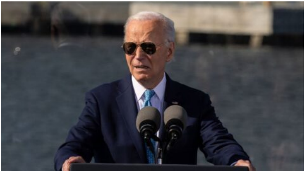
Bílý dům podle AP potají upravil Bidenovo vyjádření k odpadkům a Trumpovým voličům