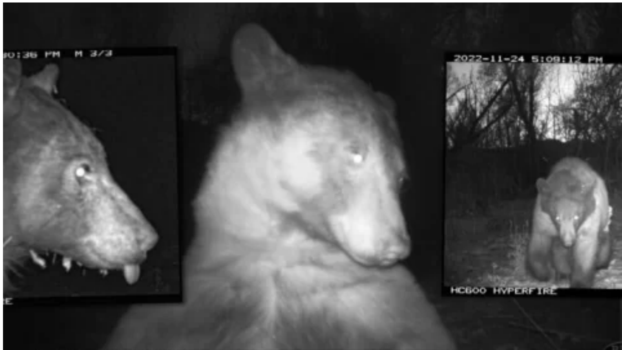
Medvěd z coloradského parku pobavil internet – na fotopasti pořídil 400 „selfie“