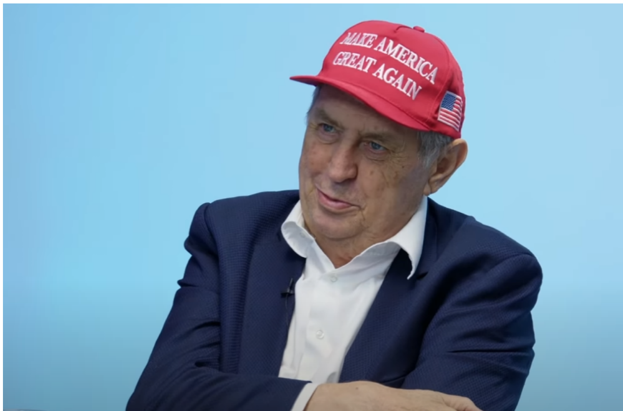
Miloš Zeman v nedávném rozhovoru v XTV

Dokonce i tiskový mluvčí ruského prezidenta prohlásil, že " Rusko nemá o Trumpovi žádné iluze ". Stejně tak, jako palestinský lid nepřestane v bojích proti sionistickému režimu na blízkém východě, jen proto, že by se Donald Trump snažil o nějaké nové smírčí dohody ve stylu Abrhámových dohod, protože genocidu páchanou ze strany IDF vůči Palestincům nezapomenou, tak ani Rusko poté, co bylo několikrát podvedeno ze strany Západu (cílené porušování Minských dohod, nátlak na Zelenského, aby nepodepisoval mírovou dohodu s Ruskem, ne/rozšiřování NATO na východ,...), se neobejme na usmíření s masovým vrahem Zelenským jen proto, že Trump přiletí do Moskvy na červeném koberci, chlapácky si potřese ruskou s Putinem a řekne "války přeci škodí byznysu, hodme to za hlavu).