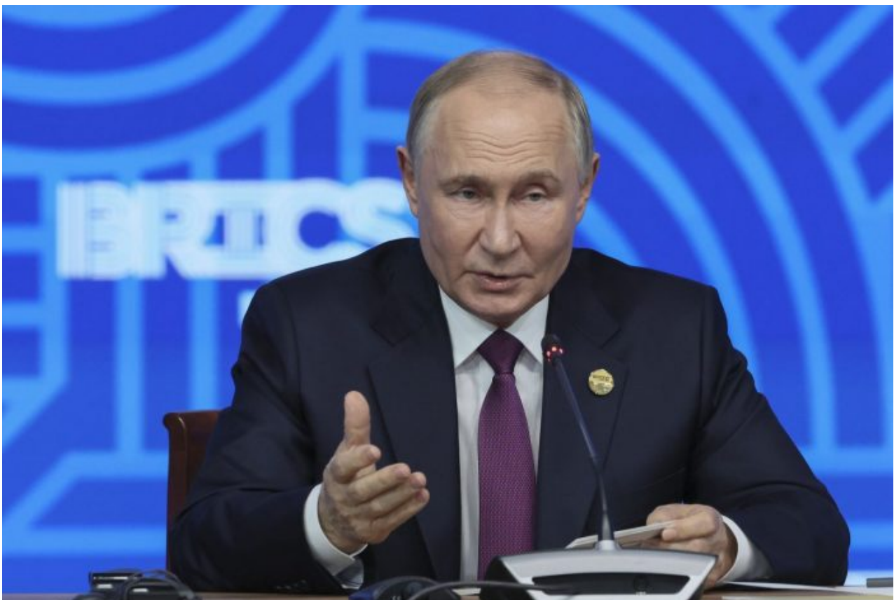
Vladimir Putin transformoval BRICS de facto na skupinu konkurující G7

Válka na Ukrajině namísto kolapsu vedla k raketovému růstu ruského HDP na skoro 4% ročně, prakticky nejvíce ze všech zemí Evropy a Rusko se vrhlo do náruče s Čínou, přičemž v americké CIA do této chvíle prý neví přesně, jestli to nebylo obráceně, že Čína se vrhla do náruče Ruska kvůli otázce Taiwanu. Každopádně Moskva a Peking se vzaly za ruce a začaly skrze svoji skupinu BRICS demontáž podvozku amerického systému Pax Americana, kterým je americký dolar.