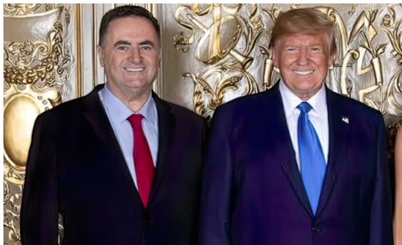
Nový ministr obrany Israel Katz s Donaldem Trumpem, foto z dřívější doby

Netanyahu podle izraelského tisku o domluvě nevěděl, prý to dohodl Yoav Gallant za jeho zády. Vyhazov Gallanta jako ministra, který se domlouvá na odvetě proti Íránu s Harrisovou a Bidenem byl jasným indikátorem, že Bibi už ví, jak volby v USA dopadnou. Místo Gallanta byl ministrem obrany jmenován Israel Katz, který má s Trumpem vztahy z minulosti a dobře se s ním zná. Netanyahu prostě Gallanta vyhodil, protože věděl kdo vyhraje v USA volby.