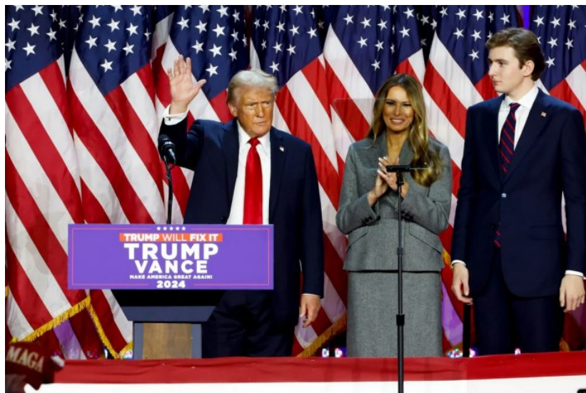
Již zjevně zestárlý Donald Trump s manželkou Melanií a o hlavu větším synem Barronem

Kdyby se Deep State povedla válka na Ukrajině a Rusko by se dostalo do kritické situace a vnitřních ořesů, volby by dopadly v USA úplně jinak a Trumpovi by nebylo dovoleno se vrátit. Místo toho by skončil za mřížemi. Nezapomeňte, že ještě do května tohoto roku chtěl Deep State prostě Trumpa zavřít, ale potom najednou soudce v New Yorku oznámil, že vynesení rozsudku odkládá na příští rok. Soudní tlak na Trumpa ustal doslova lusknutím prstu z hodiny na hodinu. Co se stalo?