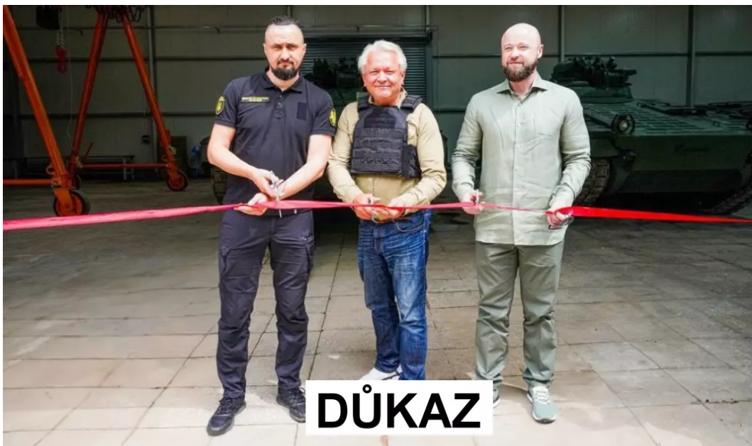
Ex-ministr strategického průmyslu Oleksandr Kamyshin, generální ředitel Rheinmetall Armin Papperger a náměstek ministra obrany Ukrajiny Dmytro Klimenkov