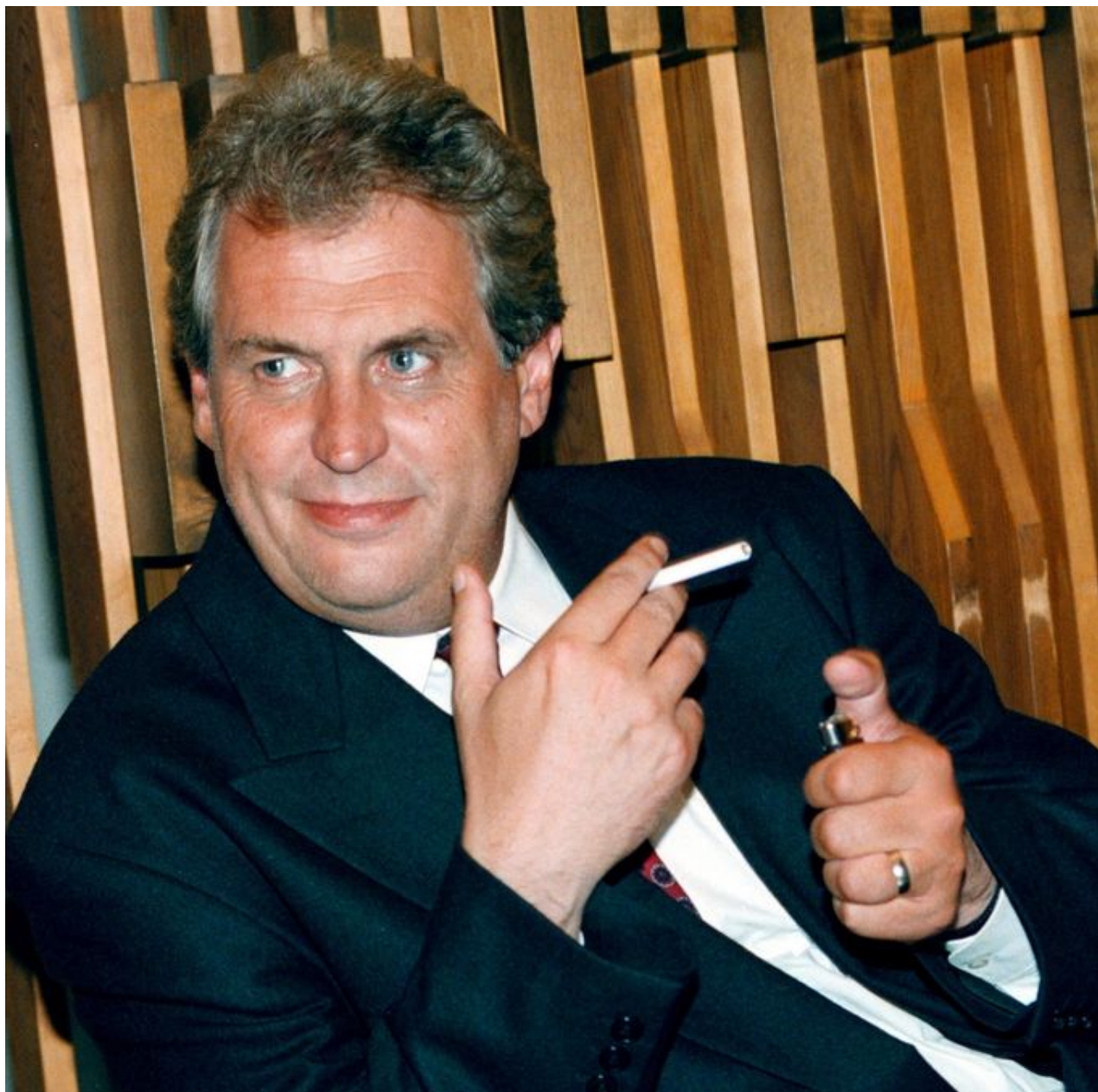
Naopak bývalý prezident, někdejší bývalý šéf ČSSD a předseda vlády Miloš Zeman reformu nazval podvodem století. Zde na snímku z roku 1996.

Sametový převrat byl dokonale připraven komunisty a dodnes zejména Pražáci věří tomu, že si tzv. revoluci u nás vycinkali studenti klíčenkami.