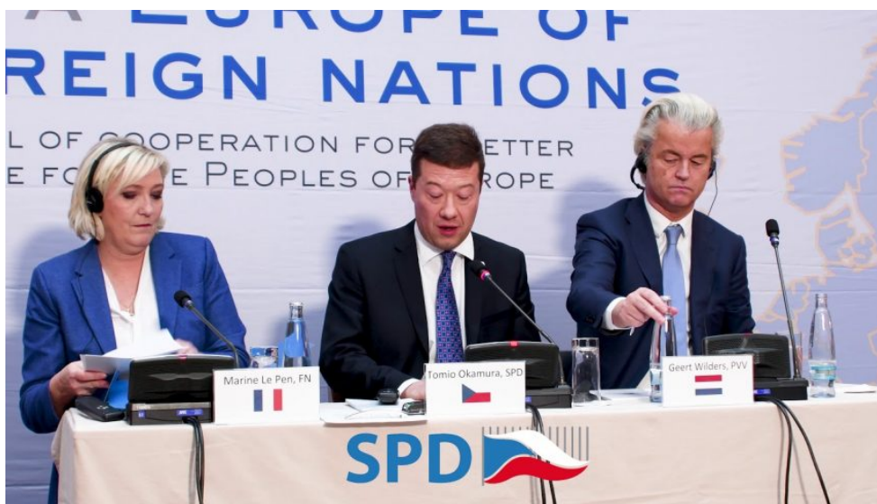
V prosinci roku 2017 se v Praze setkali Tomio Okamura, Marine Le Pen a Geert Wilders.

vystupovat z NATO, a pokud ano, že by to strana nedoporučovala. To všechno je doslova nic v porovnání s tím, co probíhá v posledním období v systémovém ukotvení SPD, které vyvolává zděšení. Začalo to už v prosinci 2017, když se SPD na pražském summitu leaderů alternativních evropských stran zastoupených Okamura, Le Penovou a Wildersem připojila k plánu nahradit ve svých volebních programem původní výzvy k vystoupení z EU k modifikované variantě plánu na pouhou reformu EU zevnitř. A teprve poté, když to prý tak nějak nepůjde, se strany vrátí k myšlence vystoupení z EU.