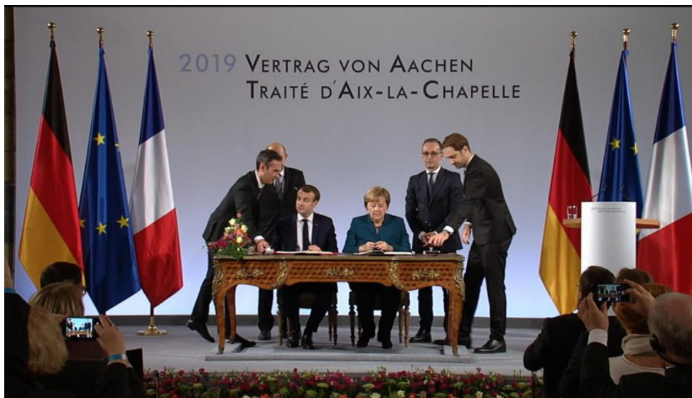
Podpis Aachenské smlouvy.

schůzka zakladatelů Evropské unie, zástupců Německa a Francie. Angela Merkel a Emmanuel Macron se zde sešli a podepsali velkou německo-francouzskou dohodu [1] o těsné spolupráci a konečné budoucí integraci , čímž de facto obnovili podobně motivovanou předchozí smlouvu podepsanou v roce 1963 v Paříži. Smlouva vyzývá hned k několika krokům, z nichž hlavní je apel na vytvoření společné armády a ozbrojených sil, prohloubení ekonomické spolupráce, ale především, a to je neuvěřitelné, vytvoření německo-francouzské bezpečnostní rady jako protiváhy vůči vojenské radě NATO v Bruselu. Obě země tak zatroubily signál k rozpuštění NATO, resp. k odchodu USA z NATO v Evropě, což bude mít stejný efekt a výsledek.