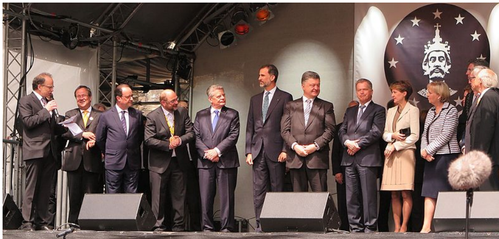
Cena Karla Velikého v Aachenu, pozvaní hosté.

Německá AfD byla v dobách, kdy ji řídila Frauke Petry, spolehlivým pilířem alternativy a odporu vůči EU a NATO. Po skončení parlamentních voleb v Německu, hned v den vyhlášení výsledků, Frauke Petry na tiskové konferenci oznámila, že odchází, vzala si tašku a sbohem. Dnes se ukazuje, proč to udělala. Stranu ovládly zevnitř sionisticko-zednářské kruhy prosazující globalizaci. Alice Weidel jako spolupředsedkyně je LGBT aktivistka a lesbička, dříve pracovala pro Goldman-Sachs, spolupředseda Alexander Gauland je členem Rotary klubu a editor rotariánského magazínu a má vazby na londýnskou zednářskou lóži Ordo Lumensis, kterou založili Rothschildové, tedy ti samí Rothschildové, pro jejichž banku pracoval francouzský prezident Emmanuel Macron. Z německé AfD se tak stala židozednáři a sionisty řízená opozice. O tom svědčí i to, že AfD založila členskou organizaci určenou pro Židy [2], aby prý byla strana zbavena nálepky antisemitské partaje. Hotový Gleichschaltung.