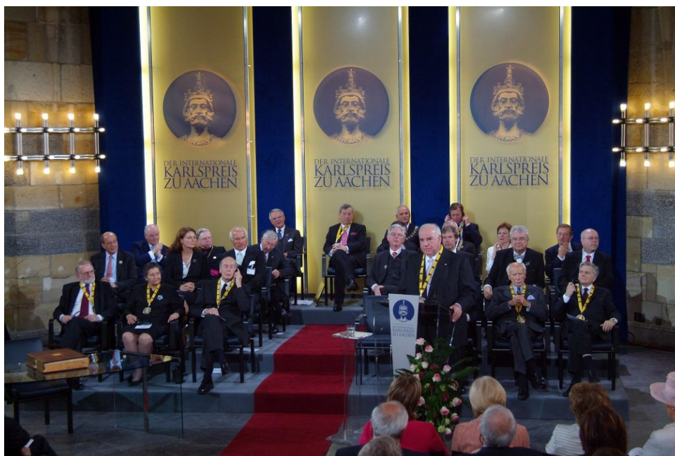
Největší slavnost sionistů: Předávání ceny Karla Velikého.

A tak najednou i v SPD začíná probíhat totéž, co v německé AfD. Ve vedení strany probíhají názorové posuny dalece vzdálené slibům před volbami, poslanci za SPD ve výborech ve sněmovně varují před dezinformačními weby a ruskými akcemi a vychvalují špičkové práce čučkařů, kteří mezitím přepisují školní učebnice jako kdysi Sicherheitsdienst za Protektorátu. Jenže tito lidé v SPD už chápou procesy v Evropě a ví, že Francie a Německo budou novými velmocemi v rámci globalizace a Velká Británie je pro ně už dnes velmocí, protože je sídlem světové sionistické globalizace a především sídlem světového zednářstva, což je jejich rekruotační středisko výchovy nových poslušných řídicích elit pro sionisty okupované země. Chceš podíl na moci? Musíš přijmout svatavu v zednářské lóži. Proč myslíte, že Ivan Bartoš jako předseda Pirátské strany byl vloni v Barceloně na zednářské okultní výstavě La Llum Negra? [6] Protože se musel podrobit zednářské svatavě. A jakmile se podrobil, už oznámil do médií, že má plány být premiérem [7]. A média ihned a ochotně o tom informovala, poslušně a servilně.