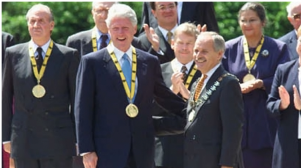
Držitelé Karlovy ceny. Bill Clinton a za ním Václav Havel.

Takže už víte, odkud vychází globalizace? Z osidel světového sionistického židovstva. Jsou to oni, kdo vymysleli současnou globalizaci, kdo navrhli její principy, systémy řízení, kdo uvedli do praxe model “ekonomického růstu na základě vyvolaných krizí” a “systém nekonečného sporu a válek” , který zaručuje nekonečný ekonomický růst a opakující se krize. Všichni globalisté mají to společné, že pracují ve prospěch plánu na vznik světové sionistické vlády na úkor zájmů vlastních národů, ze kterých pochází. Zvrácené, že? Zájem globalizace je totiž nadřazen zájmu jednotlivých národů.