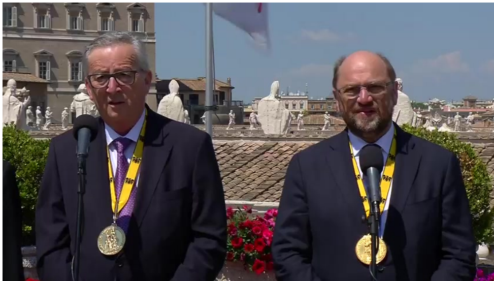
Dva držitelé ceny Karla Velikého: Jean-Claude Juncker a Martin Schulz.

Vážení čtenáři, děkujeme Vám za přízeň, kterou nám zjevně zachováváte i v novém roce. Doufáme, že články na Aeronetu, titulkovaná videa a páteční rozhlasové pořady se Vám líbí, a že skutečně obohacujeme váš znalostní a informační rozhled ve světě dnešních politických procesů a událostí. Děkujeme za Vaši finanční i morální podporu, kterou nám projevujete, bez Vás a Vaší pomoci bychom tu dnes již nebyli, protože za námi stojíte jen Vy a nikdo jiný. Nemáme fondy, nečerpáme dotace, neplatí nás oligarchové, ani ministerstva skrze státní rozpočet. Do konce měsíce zbývá 8 dní a zatím jsme vybrali 68% z cílové částky potřebné na zachování provozu našeho projektu na příští měsíc. Zvažte prosím jakýkoliv příspěvek, pokud si to můžete dovolit, moc nám tím pomůžete. Přispět nám můžete bankovním převodem, PayPal, Bitcoinem anebo poštovní poukázkou, všechny informace najdete na naší darovací stránce zde . Píšeme pro Vás a jen díky Vám. A jak vidíte, stále bojujeme o přežití, neustále se nás snaží umlčet, všemi cestami, včetně cenzury a zahazováním emailů. Děkujeme vám, že jste v tom boji s námi a že nám pomáháte!