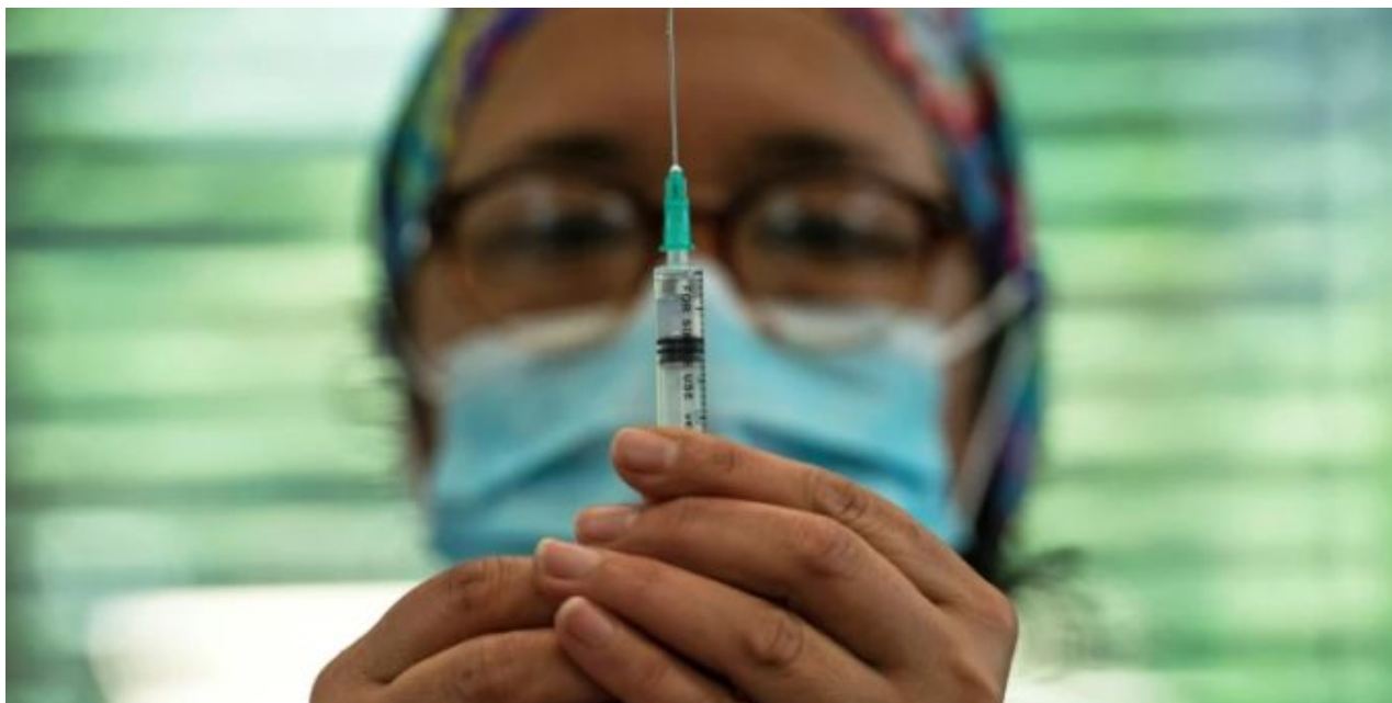
Lékař připraví Vakcíny. (Obrázek ikony)