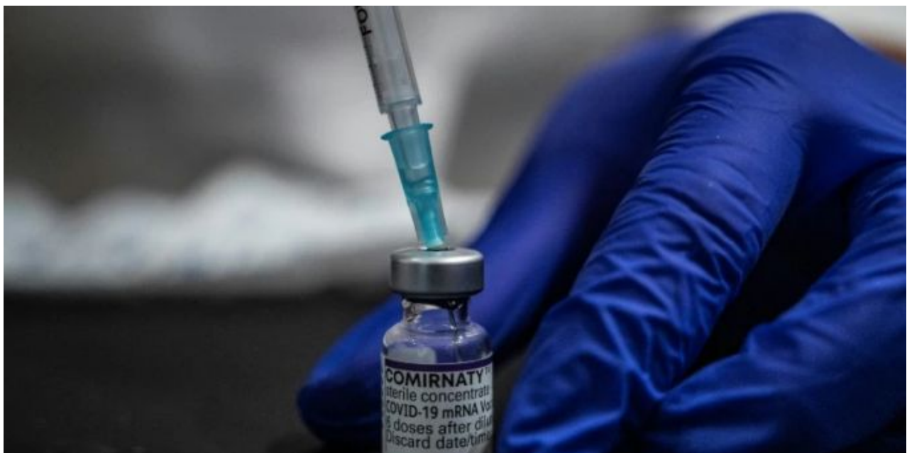
Corona-Impfstoff. (Obrázek ikony)

Dokonce odkazoval na něj jako "Turbo-rakovina". Tyto nádory často se objevil krátce po podání Corona očkování a ukázala neobvykle agresivní výraz a rychlé šíření.