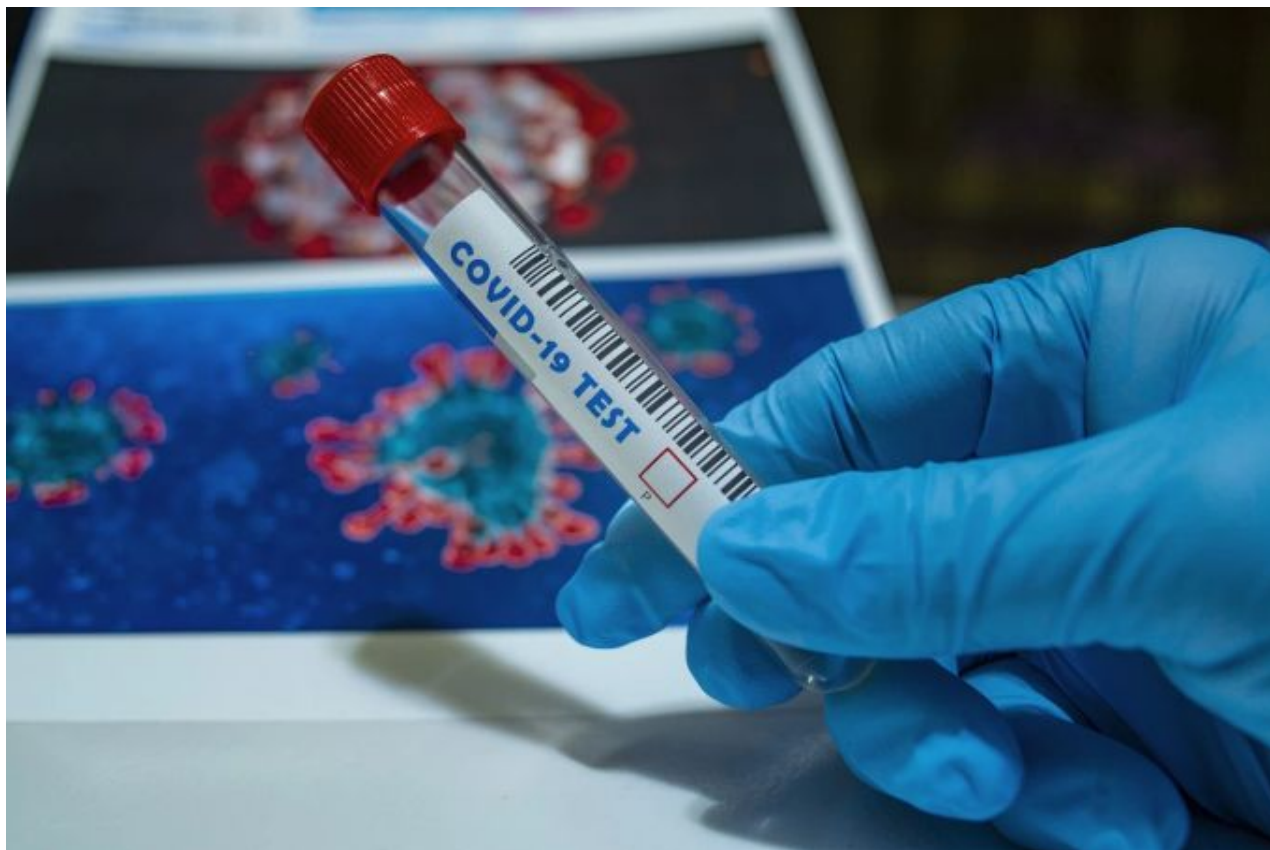
Corona očkování: mladí muži setkat na následné škody. (Obrázek ikony)