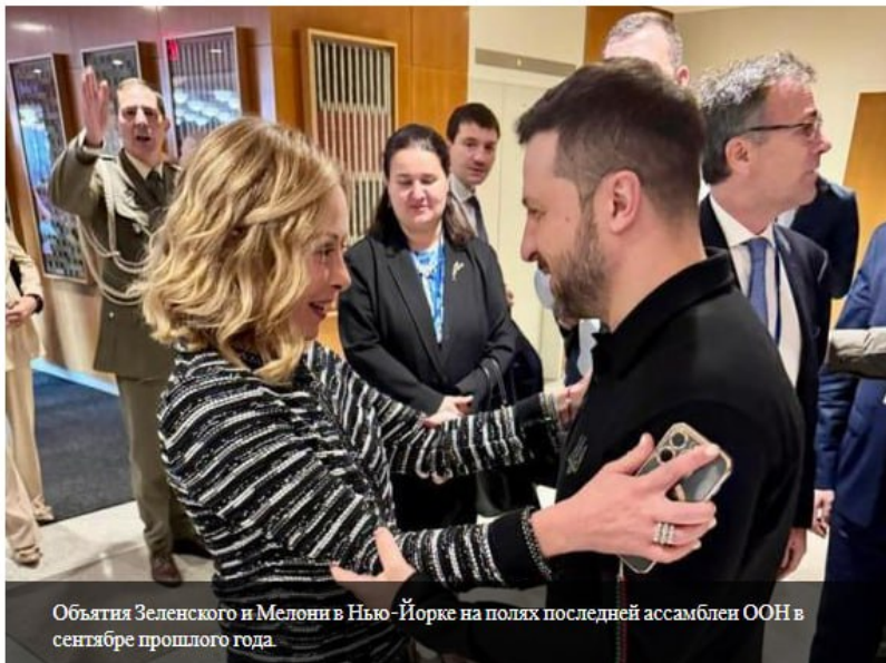
Объятия Зеленского и Мелони в Нью-Йорке на полях последней ассамблеи ООН в сентябре прошлого года

Украинский лидер из Мелони и в европейских столицах. Цель: гарантии вступления в Союз. В обмен на некоторые обязательства он был бы готов к прекращению огня по нынешней линии.