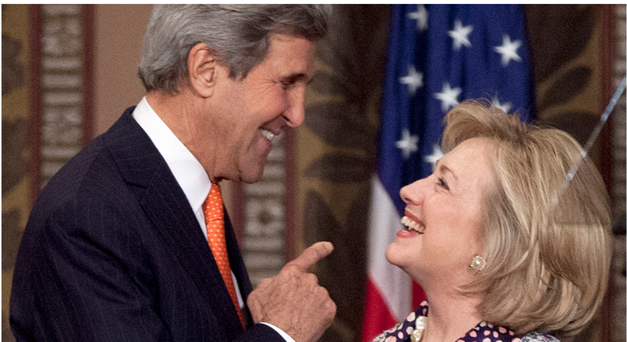
John Kerry s Hillary Clinton

Clinton nadále nabízí učebnicový příklad narativu proti svobodě slova. Zatímco usiluje o plošnou cenzuru všeho, co je považováno za dezinformaci, Clinton uvádí konkrétní příklady, které jsou již zakázány federálním zákonem, jako je dětské porno.