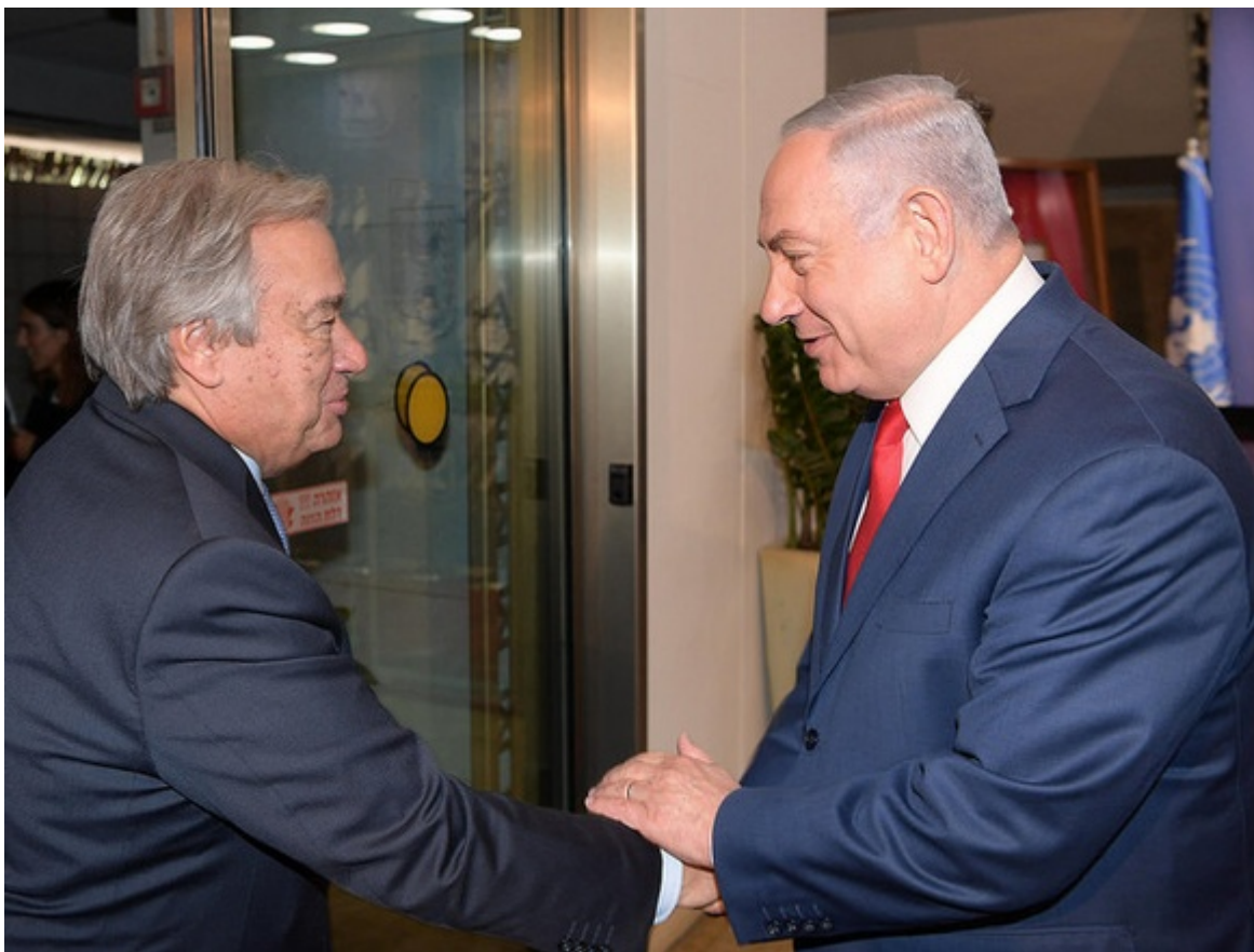
Vzácná fotografie, kdy si GT OSN António Guterres podává ruku s Izraelským premiérem Benjaminem Netanjahuem

Přijetí zákonů, varuje generální tajemník OSN António Guterres , „by fakticky ukončilo koordinaci ochrany konvojů, úřadů a krytů OSN sloužících statisícům lidí“. Poskytování přístřeší, potravin a zdravotní péče by se bez agentury „zastavilo“. Přibližně 600 000 dětí „by přišlo o jediný subjekt, který je schopen znovu zahájit vzdělávání, což by znamenalo riziko osudu celé generace“.