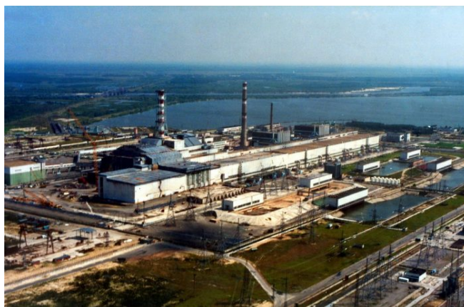
Jaderná elektrárna V. I. Lenina v Černobyli

Kyjevský režim se nenechá prostě snadno zlikvidovat, bude se držet u moci za každou cenu, a když se ukáže, že NATO neotevívá Ukrajině dveře dost rychle a ochotně, obstarají si banderovčiky jaderné zbraně. V dobách Sovětského svazu se totiž výroba jaderných hlavic odehrávala právě na Ukrajině, kde probíhala montáž hlavic v závodech jaderného průmyslu v Dněpropetrovsku a v Charkově.