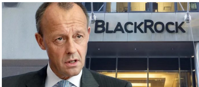
Šéf CDU Friedrich Merz pracoval donedávna pro německou pobočku americké investiční firmy BlackRock

Tato síť provozuje dva typy družic, civilní a vojenské. Merz je na rozdíl od Scholze připraven tyto rakety Ukrajině poskytnout a německá Luftwaffe je bude z Büchelů navigovat na ruské cíle. Pokud k tomu příští rok opravdu dojde, bude Německo po 80 letech znovu ve válce s Ruskem. A Evropa ve válce s Ruskem, to je cíl amerických neoconů. Američané se budou dívat a Evropa znovu, jako v roce 1941, potáhne do války proti Rusku. Kdo se nepoučí z vlastní historie anebo kdo ji zapomene, je donucen si ji zopakovat. Takže, jsme v situaci, kdy Zelenský dává ultimátum Bruselu a šéf CDU dává ultimátum Putinovi. Jsme tedy blíže k míru, anebo jsme blíže k válce? Tohle je otázka, kterou by si měli položit všichni politici, než bude pozdě.