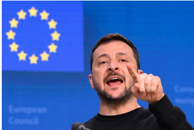
Zelenský v Bruselu působil agresivně

na sestrojení jaderných zbraní z vlastních zdrojů, disponuje závody na obohacování uranu, a rovněž má vlastní zdroje uranové rudy.