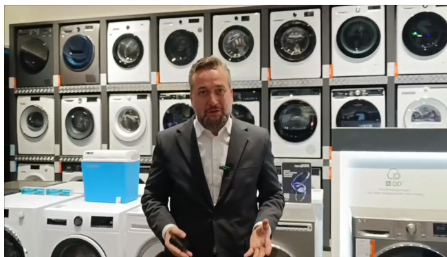
Luboš Blaha v obchodě s domácími spotřebiči v Moskvě zkontroloval zásoby praček

Ta náhlá rusofobie, odstraňování pomníků sovětských maršálů, zpravodajské hry proti Rusku, kauza Novičok, kauza Ricin, kauza Vrbětice a dvojice Čuk a Gek, protiruská hysterie, nálepkování webů, zakazování webů, kádrování a vyhazování profesorů z fakult, prostě tyto rusofobní a šovinistické procesy vykreslující západní země jako apex demokracie, zatímco Rusko jako totalitní a rozvrácenou zemi, začaly v roce 2014 v synchronizaci se šovinizací Ukrajiny. Londýn věděl, že pokud chce vyvolat nové tažení do Ruska, musí k tomu použít Ukrajinu a odvíčkovat konzervu banderismu a rusofobie.