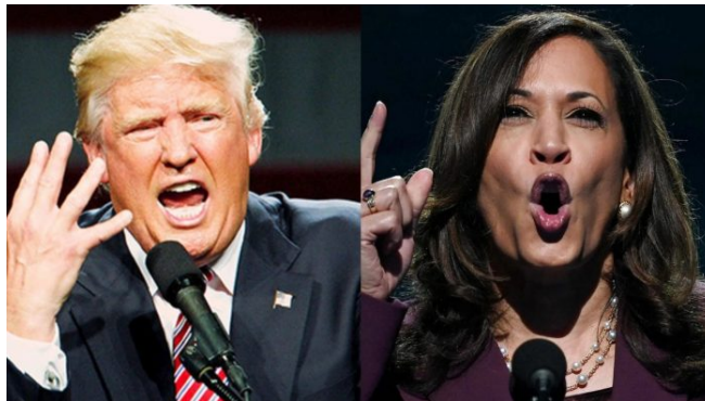
Tandemová nabídka pro III. sv. válku?

Na řadu tak logicky přišla pozemní operace do Ruska. Ukrajinská armáda ale selhala i v tom, cílů nedosáhla. Takže jedinou cestou je teď pozemní invaze NATO do Ruska. A s tím se na počátku nepočítalo. A to není snadná varianta. Ale je tu tandemové řízení a válka na Blízkém východě jako varianta k Ukrajině. Válka s Íránem by ztelně oslabilo Rusko, dokonce by zřejmě do války Rusko zatáhla, přičemž ani Čína by nemohla zůstat pozadu.