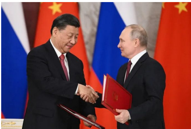
Prezidenti Xi Jin-Ping a Vladimir Putin

Rusko by totiž pro válku s NATO potřebovalo Čínu jako spojence č. 1, tedy pro válku bez použití jaderných zbraní. A tomu se budou všichni bránit do poslední chvíle. Konec války proto opravdu může být na cestě. Svědčí o tom i neuvěřitelný a náhlý návrat [4] českého velvyslance do Moskvy. Tohle nevypovídá o tom, že by se chystala III. sv. válka v blízké době, ale spíš to vypadá právě na děsivou povinnost – Ukrajina v EU i v NATO, a Rusko rozšířené o 4 ukrajinské oblasti plus Krym, ovšem pouze na bázi příměří, nikoliv mírové smlouvy. A to příměří obě strany využijí k horečnému zbrojení a dozbrojení v přípravě na III. sv. válku mezi NATO na jedné straně a Čínou po boku s Ruskem a KLR na straně druhé.