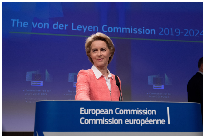
Ursula von der Leyen

nepovedou USA, ale evropské státy, kterým bude radit Ukrajina a současně ukrajinská armáda má mít vedoucí funkci ve velení v budoucí válce proti Rusku. Pokud by totiž existoval plán, jak přesunout americká vojska z Evropy do jihovýchodní Asie a rovněž na Blízký východ, tedy proti Číně a proti Íránu, potom by logicky ukrajinská armáda do této kalkulace vzniku Evropské armády plně zapadala!