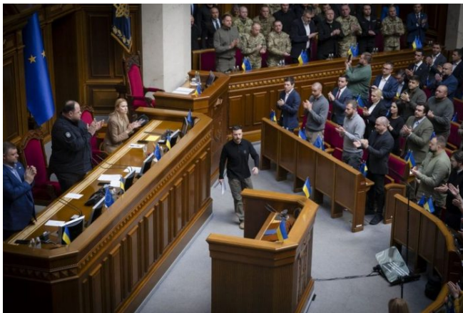
Příchod Zelenského do Nejvyšší rady, 16. 10. 2024

Hraje se totiž o vstup Ukrajiny do NATO teď hned a v této situaci výměnou za odstoupení území, ale ne výměnou za neutralitu Ukrajiny, ani za denacifikaci Ukrajiny. Pro Moskvu bude plán naprosto nepřijatelný. Moje hodnocení je takové, že tento plán nejen nepřibližuje mír na Ukrajině, jak si myslí Robert Fico, ale naopak urychluje eskalaci k zatažení NATO do III. sv. války s Ruskem, kdy NATO nechce uznat svoji porážku a jedině přijetím Ukrajiny do NATO se toho dosáhne. Když přijmeme Ukrajinu do NATO teď a hned, prokážeme tím světu, že jsme válku vyhráli a Rusko nedosáhlo svých cílů, i když odtrhlo Ukrajině nějaké území.