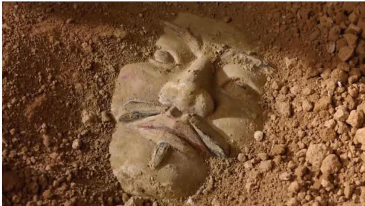
Tajemství terakotových válečníků: Úžasný archeologický nález