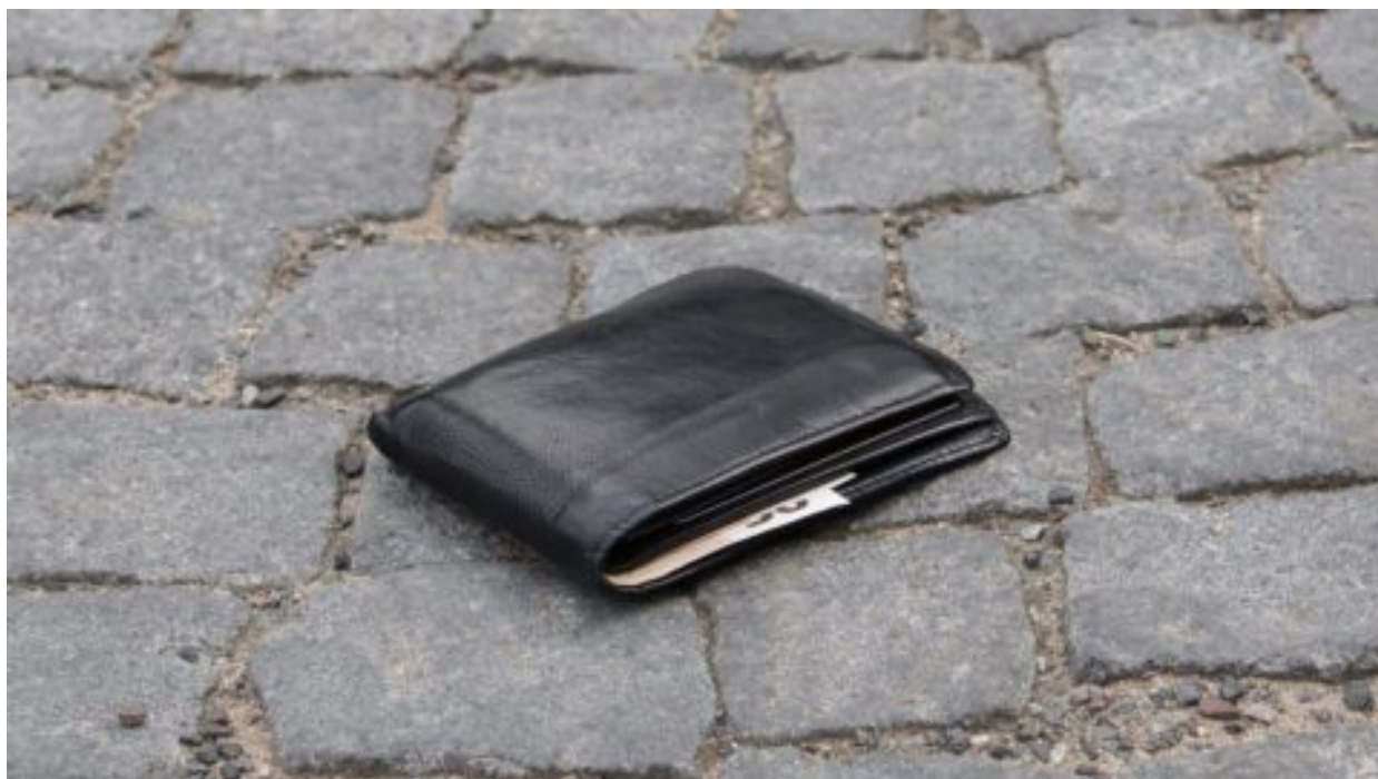
Chlapcova poctivost zachránila v Praze víc než 100 000 korun řidiči autobusu