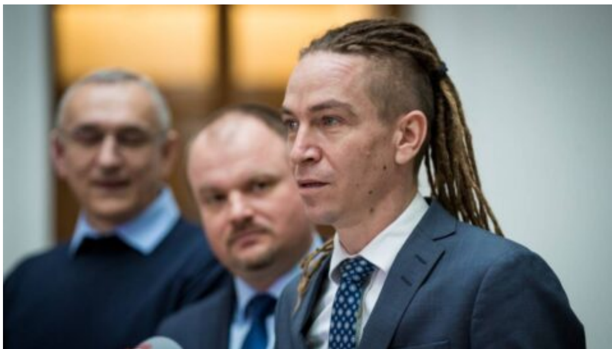
PhDr., Ph.D., DJ, dlouholetý předseda Pirátů a zřejmě končící ministr: Ivan Bartoš