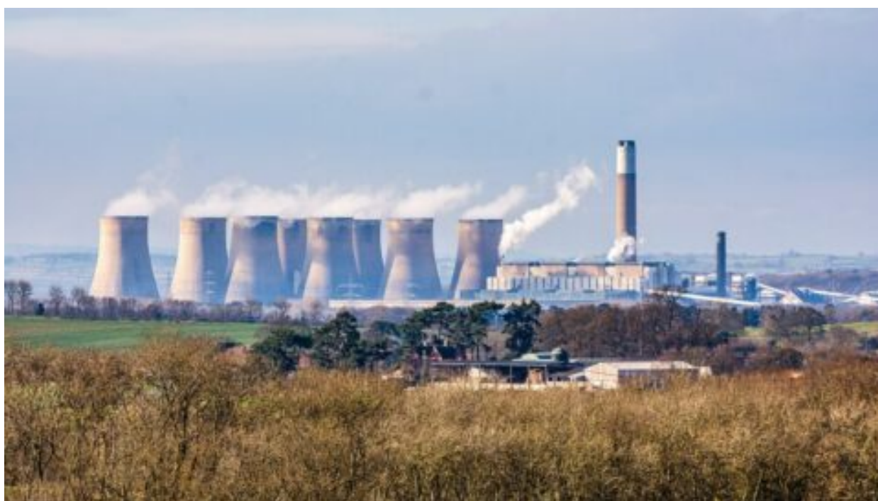
Konec jedné éry – Británie v září uzavře poslední uhelnou elektrárnu. 11 % elektřiny ale dováží