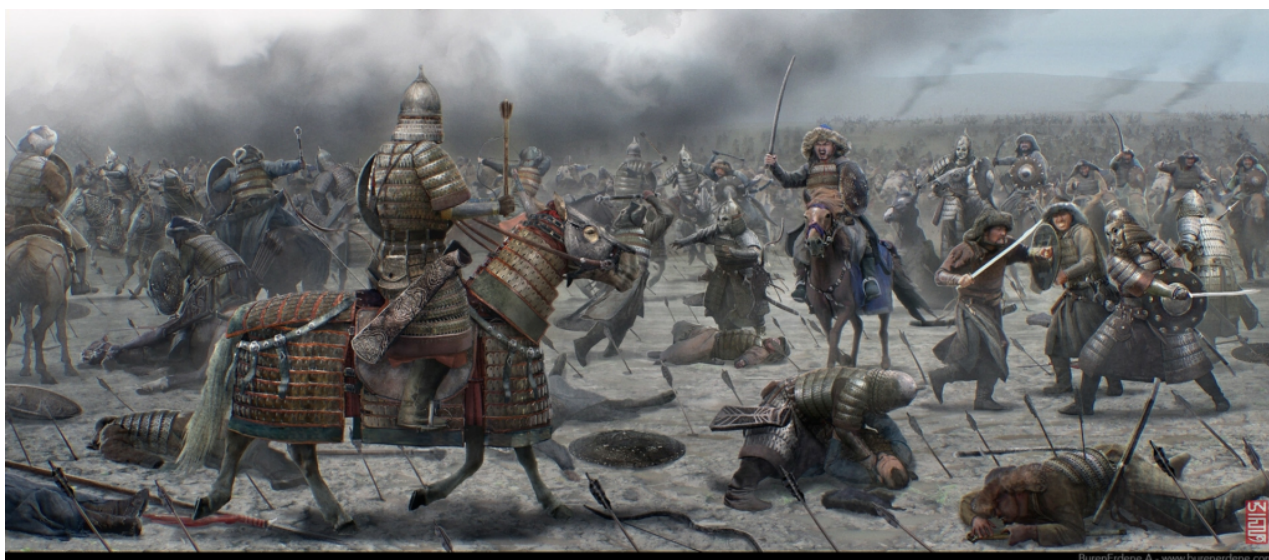
Mongolská dobovačná bitva s Rusy

Mongolové se však jako silnější vrátili do ruských stepí v roce 1236 a nejprve zaútočili na oblasti střední a horní Volhy proti Volžským Bulharům, přičemž v následující zimě 1237/1238 pokračovali v nájezdech do středoruských knížectví, když zamrzly ochranné bažiny, jezera a řeky. Následně Mongolové zničili prosperující města ve Vladimirsko-suzdalském knížectví, zejména po bitvě na řece Sit 4. března 1238, kdy porazili ruská vojska. Území Novgorodu, včetně samotného města Novgorod, se zachránilo jen díky blížícímu se jarnímu počasí, kdy začal tát sníh a led, a proto se Mongolové neodvážili nechat se zastihnout táním mezi okolními novgorodskými bažinami. Přesto následujícího roku (1239) jihozápadní části Kyjevské Rusi utrpěly od Mongolů zkázu. Samotné město Kyjev bylo vyplněno v roce 1240, následováno řadou dalších osad.