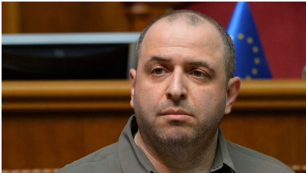
Rustem Umerov, ministr obrany Ukrajiny

Dokonce už i český mainstream o tom píše [3], a to je co říct. Prostě, všechny kroky Syrského opravdu vypadají, že pracuje pro Rusy úplně ve všech ohledech, a to prakticky už nepokrytě. Zelenský se totiž zbláznil a uvěřil bizarnímu plánu o vítězství, který mu podle informací posunul právě Syrský. A vedle něho i Rustem Umerov, ukrajinský ministr obrany. Oni dva prý přesvědčili Zelenského o šíleném plánu, že Rusy půjde donutit k míru, když Ukrajina stáhne své veškeré schopné bojové jednotky z Donbasu a vrhne je do Kurské oblasti. Tohle byl ten plán. A výsledek? Ruská armáda prolomila linie AFU na Donbasu, a to prakticky bez námahy a lehce.