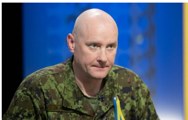
Vahur Karus, náčelník GŠ estonské armády

Podle Pevkura nejde jen o posílení koncepce představené obrany NATO, ale také o posílení hranic Evropské unie, a proto musí být EU součástí rovnice financování. Baltská obranná linie se bude táhnout podél hranic Estonska, Lotyšska a Litvy s Ruskem a Běloruskem. Jejím cílem je prý odvrátit vojenské hrozby pomocí sítě obranných struktur a posílit tak novou strategii NATO, která spočívá v ochraně spojeneckého území již od prvního metru. Polsko, které čelí vlastním bezpečnostním výzvám, v květnu oznámilo svůj projekt East Shield, což signalizuje bezprecedentní regionální tlak na posílení obranné infrastruktury ve zjevné přípravě na válku NATO s Ruskem.