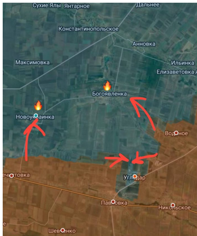
Situace Ugledaru v neděli 29. září večer

A to stále není všechno. Pobaltské státy po vzoru Ukrajiny chtějí vybudovat opevněné válečné linie na hranicích s Ruskem a s Běloruskem v přípravě na válku [3]. Ministři obrany Estonska, Lotyšska, Litvy a Polska se sešli v lotyšském Daugavpilsu, aby podpořili projekt Baltské obranné linie – opevněné hranice – a prosadili jeho financování ze strany Evropské unie. Estonský ministr obrany Hanno Pevkur v prohlášení uvedl, že Baltská obranná linie získala na síle, protože spojenci v Pobaltí sdílejí stejné bezpečnostní obavy. Úzká koordinace s Polskem je zásadní a Estonsko rovněž vidí možnosti rozšíření spolupráce se severními spojenci, zejména s Finskem.