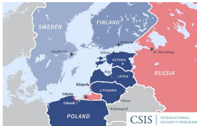
Pobaltské státy a Polsko chtějí vytvořit společnou linii opevnění na hranicích s Ruskem a Běloruskem

A z toho pramení panika. Panika při pohledu na to, jak Ukrajina míří ke svému neslavnému konci, a přitom celou dobu si ukrajinské elity myslely, že když Rusko napadne Ukrajinu, že NATO přispěchá na pomoc s plnou polní. Ale to se nestalo. Ukrajinci mají nakonec jen jednu úlohu – zpomalit postup Rusů směrem na Západ. A to zpomalení se provádí házením ukrajinského masa před kola valící se ruské válečné mašiny. Ukrajincům to trvalo dlouho, než jim došlo, že tato role není o budoucnosti, ale naopak o konci Ukrajiny. A jak daleko pojede ruská mašina na Západ? Ke Kyjevu? Ke Lvovu? K Varšavě? Ku Praze? K Paříži? To je úplně jedno, protože panika v pobaltských státech mluví za vše.