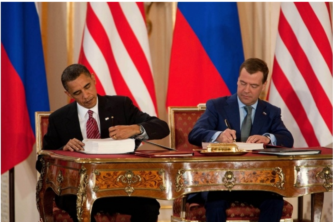
Barack Obama a Dmitrij Medveděv po podpisu smlouvy START III (New START) v Praze 8. dubna 2010

Smlouva New START měla trvat deset let s možností prodloužení až o pět let po dohodě obou stran.