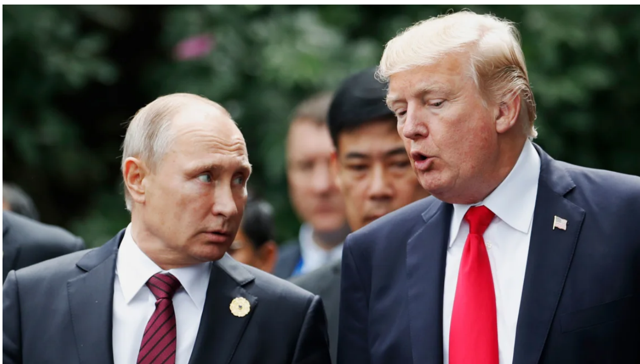
Ruský prezident Vladimir Putin s americkým prezidentem Donaldem Trumpem

To byl poslední pokus Spojených států a Ruska o zvýšení vzájemné jaderné bezpečnosti prostřednictvím dvoustranných jednání.