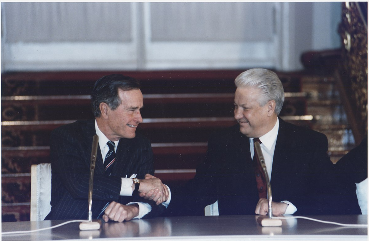
Prezidenti George H. W. Bush a Boris Jelcin podepisují 3. ledna 1993 ve Vladimírském sále moskevského Kremlu smlouvu START II .

Důvodem bylo rozhodnutí administrativy George W. Bushe v červnu 2002 odstoupit od Smlouvy o protiraketové obraně (ABM) , která mezi USA a SSSR platila od roku 1972 a která byla jednou z podmínek pro uskutečnění START II .