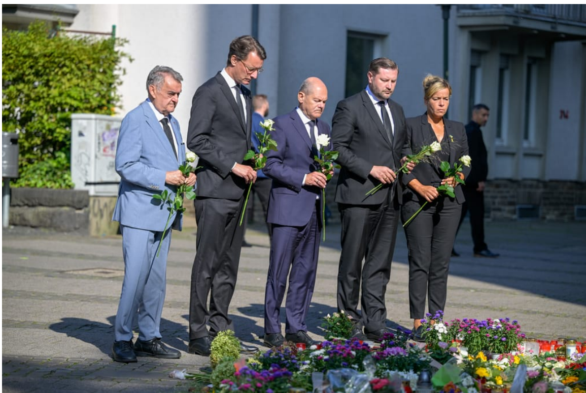
"To byl terorismus," řekl kancléř Olaf Scholz během pondělní návštěvy Solingenu.

„Vzhledem k denním titulkům o násilí páchaném cizinci už není možné říci, že takové události jsou nepředvídatelné a překvapivé,“ napsal Björn Höcke, hlavní kandidát AfD ve spolkové zemi Durynsko, která jde v neděli k volbám, na X. „Proto jsou spoluviníky vlády. Okolnosti se ale změní, až když budou odpovědní konečně odvoláni z funkce!“