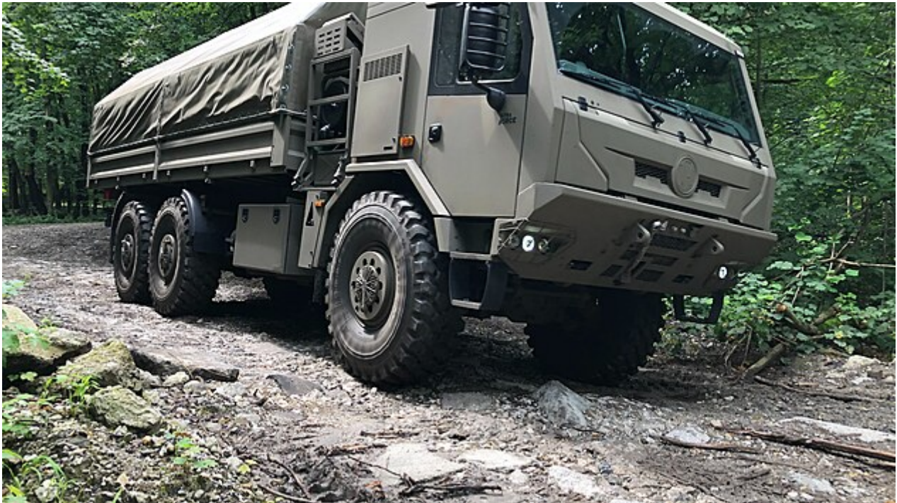
Nová Tatra Force třetí generace na zkušebním polygonu v Kopřivnici (11. července 2024)