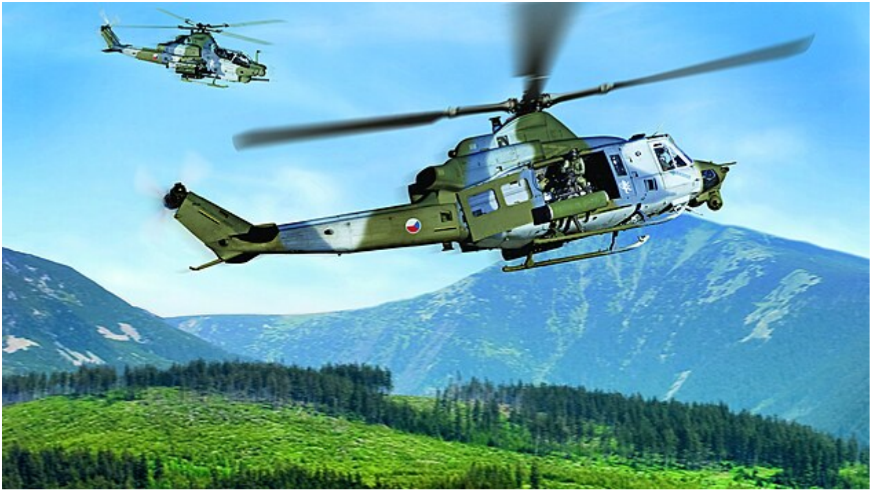
Vizualizace amerických vrtulníků Venom a Viper pro českou armádu