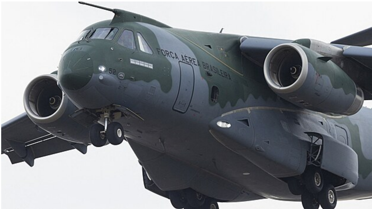
Letoun Embraer C-390.