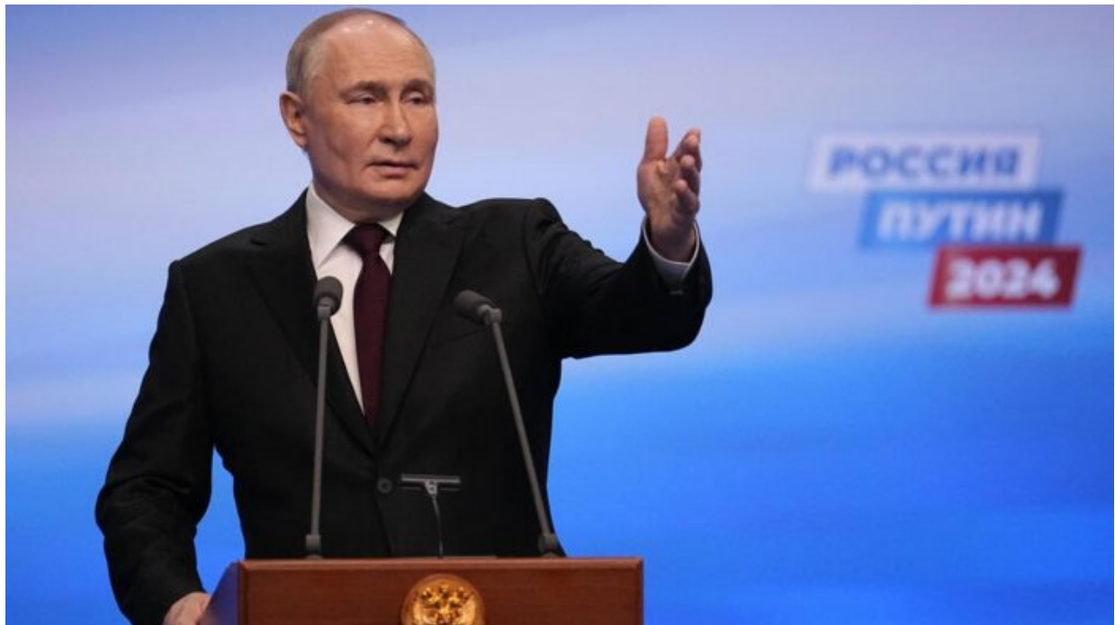
Vladimir Putin, prezident Ruské federace

NATO do Kurské oblasti. Tato nabídka na relokaci a emigraci západních občanů do Ruska proběhla naposledy v letech 1938 a 1939, těsně před vypuknutím II. sv. války.