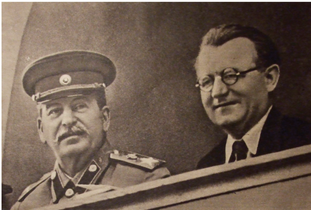
Klement Gottwald jako šéf exilové vlády Československa v SSSR společně s Josifem Stalinem

Podle informací Ruské akademie věd bylo v letech 1938 až 1939 do Sovětského svazu evakuováno na čtvrt milionu osob z celé Evropy. Ani tehdy neměl dekret naprosto žádné stanovené množstevní limity. Proto naši kolegové ruští novináři jsou z dekretu opravdu vyděšení, protože by to znamenalo, že Kreml se chystá doopravdy a bez legrace na vypuknutí III. sv. války a na konflikt s NATO. Dovedu si představit, že tato nabídka Ruska opravdu může oslovit nejen starší, ale i mladé lidi. V Rusku se lidé jazyk naučí, to je to nejmenší.