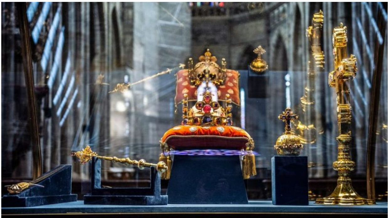
Korunovační relikvie s Ostrovským křížem – nejsilnějším známým okultním záříčem ve Střední Evropě

Teď je díky Foltýnovi moderní používat jedno slovo, konkrétně “svině”, ale nedovedu si představit, jaká slova teď na adresu Pavla hledají tady v Německu a třeba právě v Deutsche Bank. Jen aby Německo nezabavilo české korunovační klenoty, které Petr Pavel bez souhlasu památkářů vyvezl do Drážďan. Jestli se totiž během vyšetřování německé prokuratury ukáže, že Česká republika se vedle Polska rovněž na útoku na Nord Stream podílela, anebo s útokem sympatizuje, potom se s těmi korunovačními klenoty již neshledáme. Německo je zkonfiskuje.