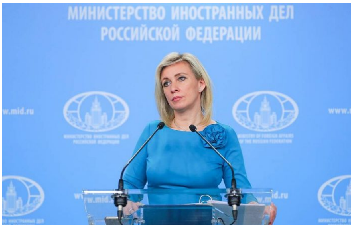
Maria Zacharova, mluvčí ministerstva zahraničí

Podle německých médií jsou na plynovodu a na majetcích Nord Stream AG různé plomby německých a švýcarských bank, mezi kterými dominují Deutsche Bank a Credit Suisse. Právě tyto velké banky a kreditní instituce poskytly většinu peněz na tyto plynovody, přičemž samotný plynovod a jeho infrastruktura je součástí tzv. kolaterálové záruky bank.