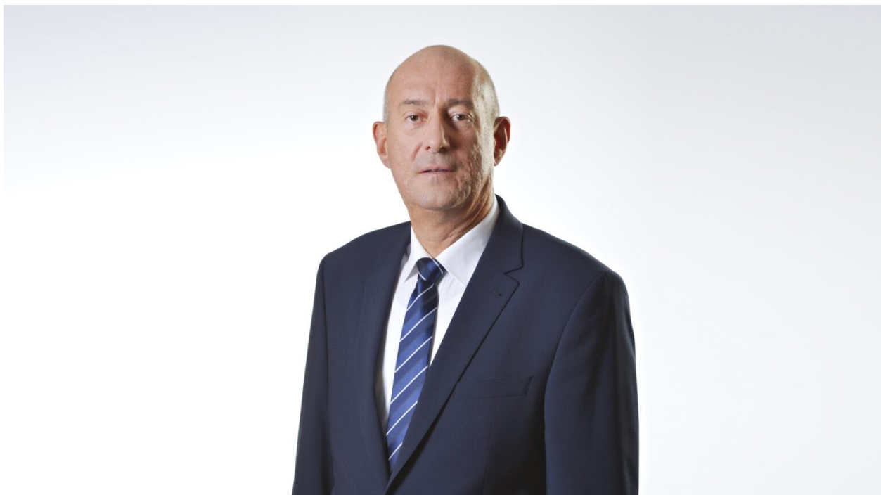
JUDr. Igor Stříž, nejvyšší státní zástupce

S vírou, že tehdy nové vedení nebude pokračovat v zakrývání faulů minulé vlády, se Kverulant počátkem února 2022 obrátil na Nejvyšší státní zastupitelství, v jehož čele stanul Igor Stříž, vystřídávší Pavla Zemana.