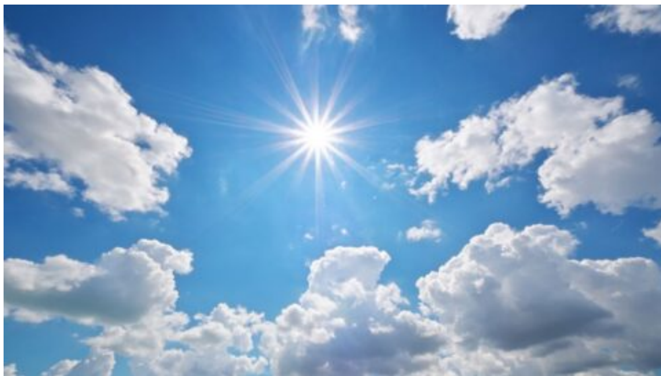
Uprostřed týdne a o víkendu se do Česka vrátí tropické teploty.