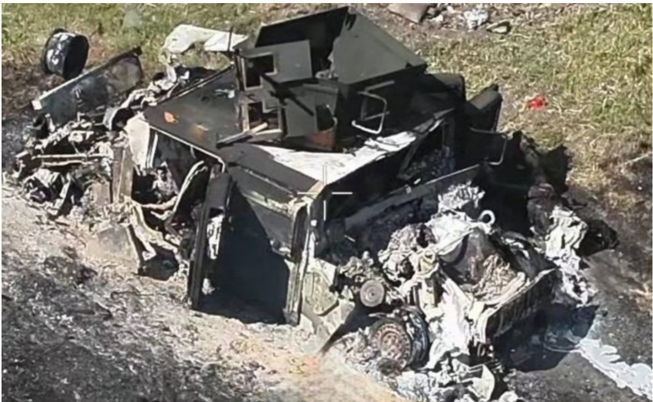
Zcela spálený automobil pěchoty Humvee vojáků AFU v Kurské oblasti

Z úniků vyplývá, že zástupci Kyjeva již nějakou dobu komunikují s poradci demokratické prezidentské kandidátky Kamaly Harrisové, nikoliv s Bidenem. To představuje vhodný okamžik, jak zvýšit sázky a postavit nový tým před hotovou věc: Podívejte se, můžeme úspěšně postupovat na ruské území, je ve vašem zájmu nás podpořit. I částečný úspěch, zajištění pouze jednoho města, by Kyjevu umožnil požadovat od Washingtonu více, a pak ještě více.