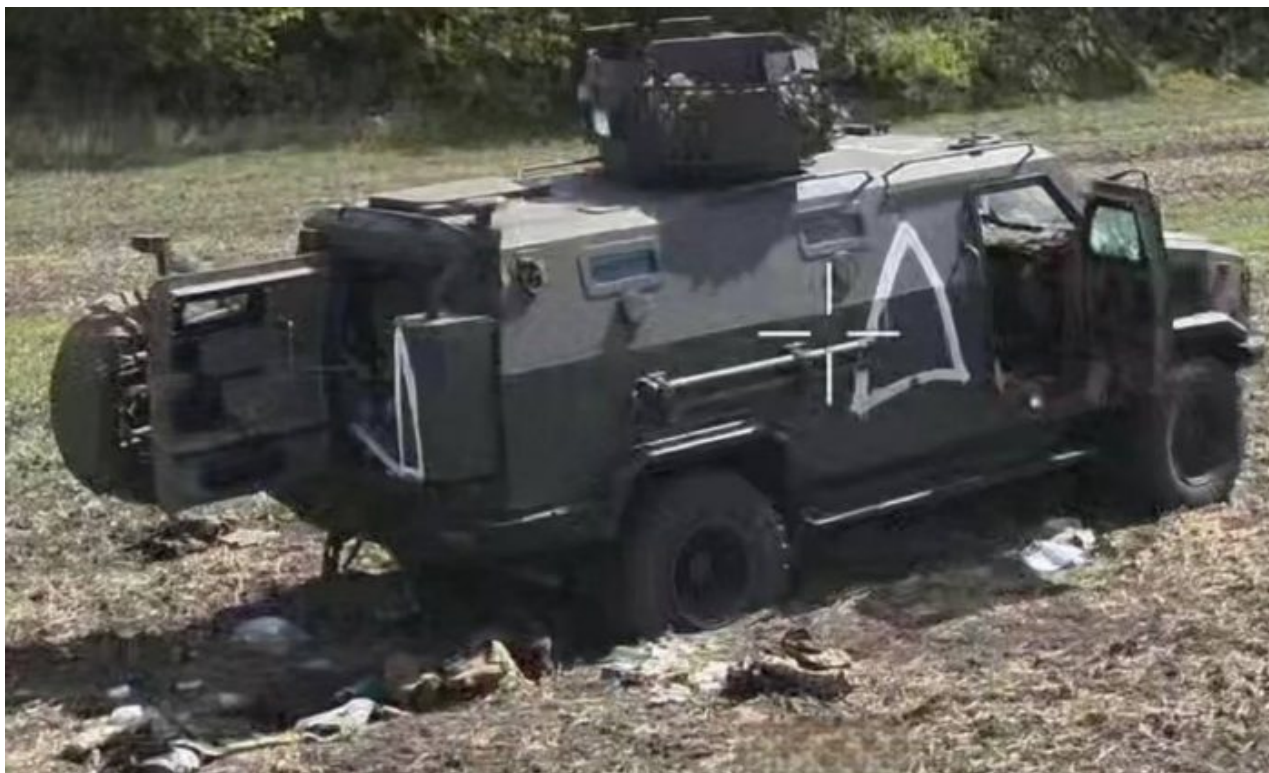
Zničená bojová technika AFU v Kurské oblasti

A konečně třetí scénář, který se vzhledem k rétorice Kremlu jeví jako nejpravděpodobnější: Neutralizovat akce Kyjeva dostupnými prostředky, vyčistit pohraniční oblast od ukrajinských sabotážních jednotek a zabránit průlomu jinam. To Rusku umožní pokračovat ve své strategii, která je podle Moskvy nejvýhodnější. V tomto případě se pohraniční oblast stane další aktivní bojovou zónou a absence rozhodné odvety umožňuje Kyjevu tvrdit, že došlo k posunu červených linií a alespoň částečnému úspěchu. Ruské spoléhání na omezené síly a odmítání stažení velkých počtů z doněckého divadla by znamenalo, že operace na zajištění kurského pohraničí by se mohla protáhnout. Brzy uvidíme, který scénář se bude vyvíjet.