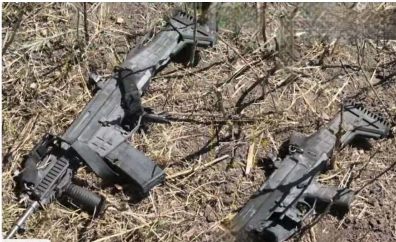
České útočné pušky CZ Bren 2 odhozené vojáky AFU na ruské půdě v Kurské oblasti

Kyjev učinil “vědomé rozhodnutí” ukončit možnost mírových rozhovorů s Moskvou tím, že zahájil vpád do Kurské oblasti, uvedl vysoce postavený ruský diplomat. “Svémi teroristickými akcemi v Kursku Ukrajina přinejmenším na dlouho pozastavila dráhu mírových rozhovorů,” řekl Mirošnik během brífinku pro média. Diplomat tento krok označil za vypočítavý krok Kyjeva, který ale plánovačům explodoval přímo do obličeje.