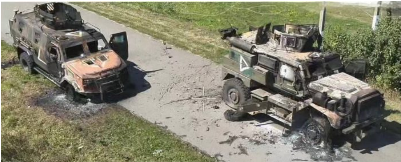
Zničená bojová technika AFU v Kurské oblasti

Tato čísla se shodují se západními zprávami. Z vojenského hlediska tvoří hrot útoku obvykle 15-20 % celkových sil, zbytek následuje, zajišťuje boky a zajišťuje logistiku, dělostřeleckou podporu a operace bezpilotních letounů. Jelikož se postup nezdařil, většina ukrajinských jednotek zůstává v Sumské oblasti a pokračuje v přeshraničních výpadech. Je pozoruhodné, že po celou dobu nepokojů fungovala (a stále funguje) čerpací stanice v Sudži, která usnadňuje tok z Ruska přes Ukrajinu do Evropy. Proč se to stalo?