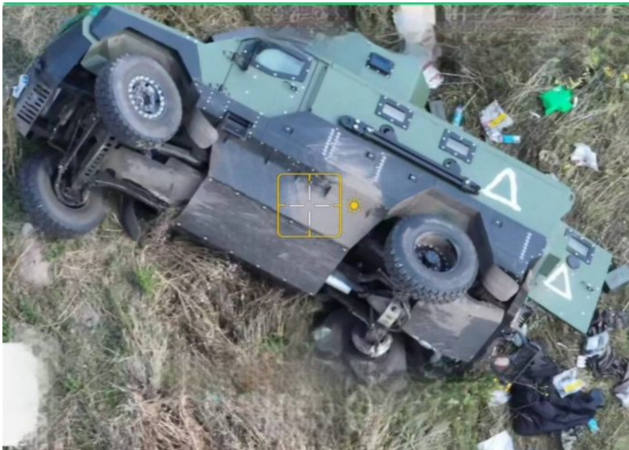
Zničená bojová technika AFU v Kurské oblasti

Je jasné, že Kyjev by k něčemu takovému souhlas nedostal, takže Kyjev se za souhlasu Londýna, který podle informací jako jediný věděl o útoku a podílel se na něm po organizační stránce, prostě pustil do invaze do Ruska s použitím všech západních zbraní, čímž byl Západ postaven do situace, kdy musí v podstatě mlčet. Nemůže Ukrajince kritizovat, to není dovoleno, ale nemůže otevřeně tento útok ani okatě schvalovat, pouze se omezuje na výroky o tom, že Ukrajina má právo se bránit všemi prostředky, a to i útokem na Rusko. Pravda ale je taková, že operace zaskočila velení NATO do takové míry, že teď už nikdo Zelenskému nebude věřit.