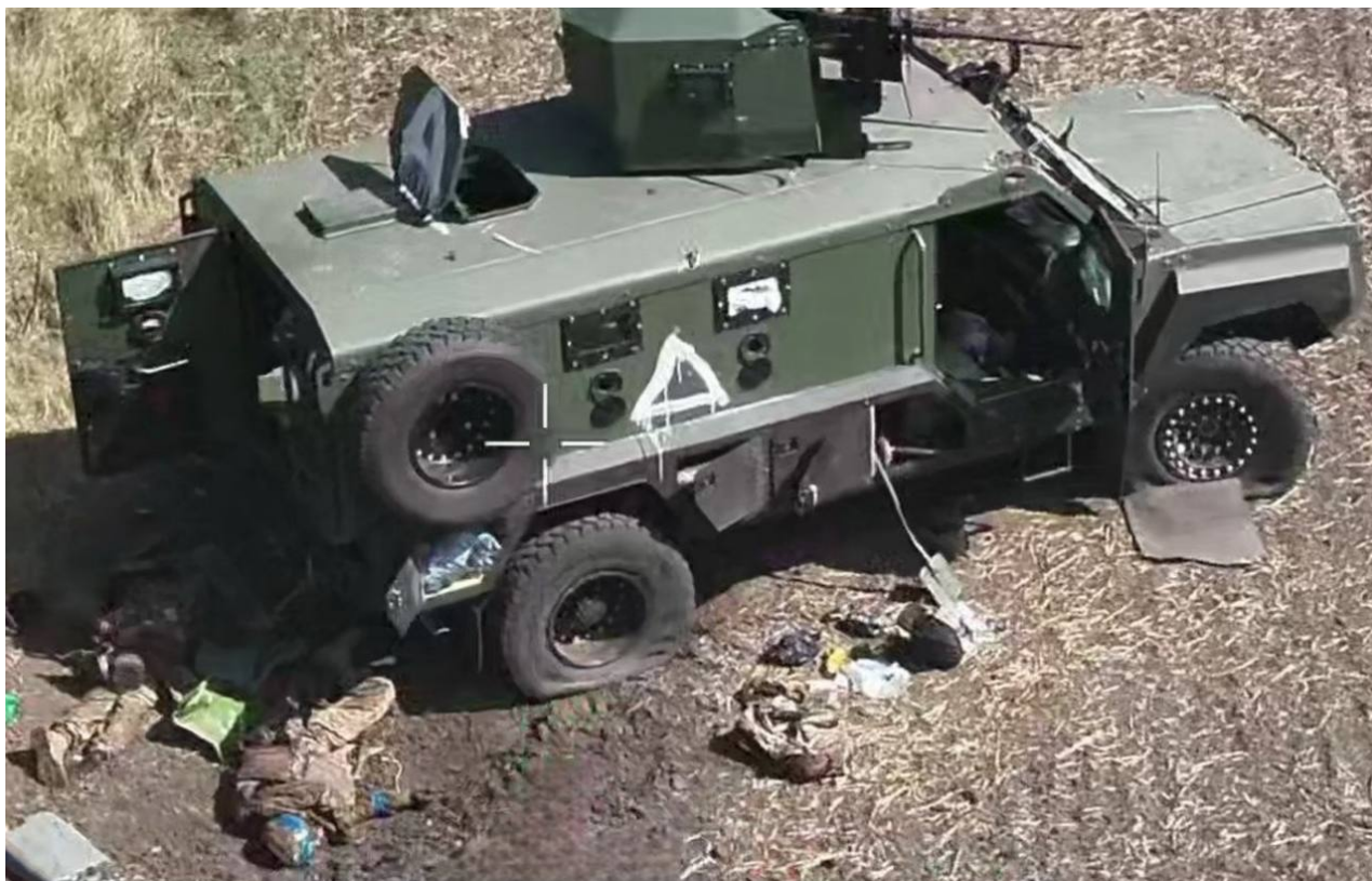
Zničená bojová technika AFU v Kurské oblasti a padlí vojáci AFU

zažehnána. Ukrajině se nepodařilo vytvořit souvislou frontovou linii v Kurské oblasti a pokud nedojde k žádnému překvapení, můžeme očekávat zdlouhavou vyčišťovací operaci k odstranění ukrajinských sil, zatímco sporadické nájezdy přes hranice budou pokračovat.