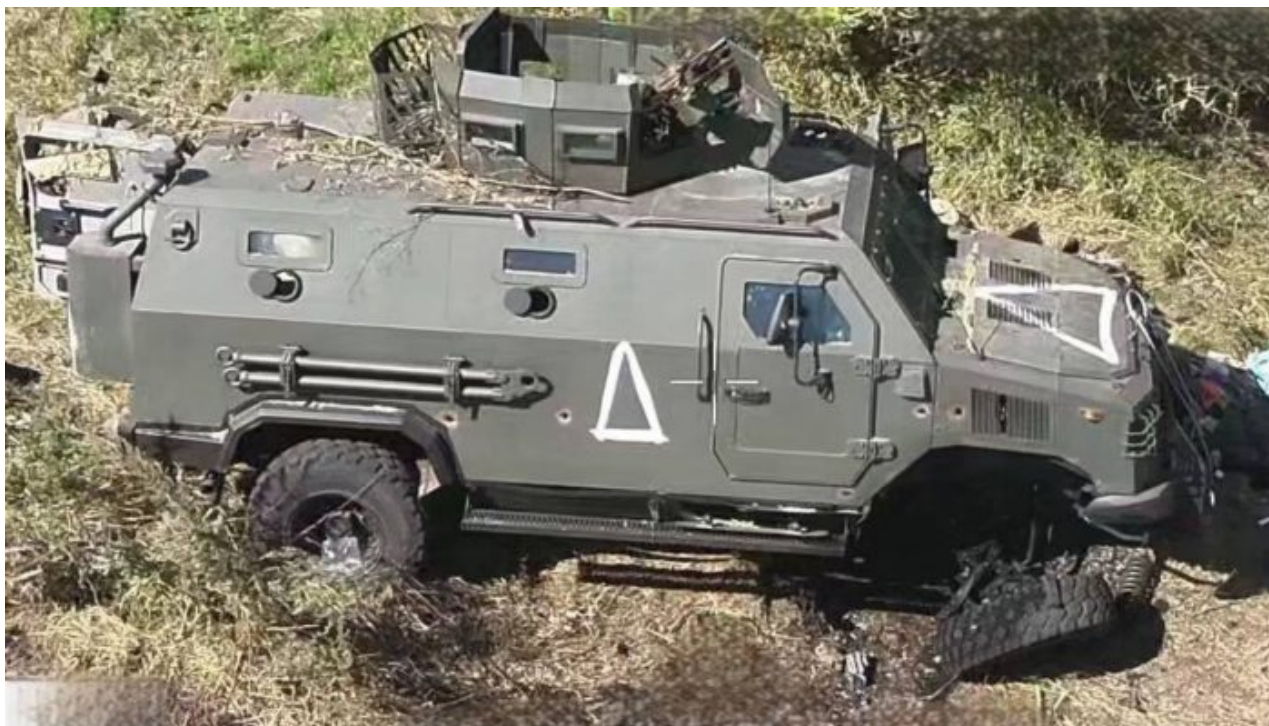
Vyřazená bojová technika AFU v Kurské oblasti

Jak již bylo zmíněno, tato trajektorie povede ke kolapsu Ukrajiny, takže zoufalá snaha Kyjeva narušit hru Kremlu je pochopitelná. Z pohledu ruského vedení znamená držení se strategie “speciální vojenské operace”, že by se nemělo příliš soustředit na události v Kursku, aby nehrálo Kyjevu do karet. Tak jednoduché to však není. Moskva nemůže ignorovat nepřátelské akce. Nejde jen o politickou legitimizaci toho, co bylo dříve nepřijatelné, jak jsme o tom hovořili.