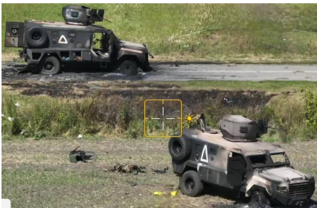
Zničená a spálená bojová technika AFU v Kurské oblasti

Operace ve směru k Azovskému moři (tzv. neúspěšná protiofenzíva) skončila neúspěchem a nyní může ukrajinská armáda pouze ustupovat a tu a tam zalepit mezery ve své obraně. Tento scénář znamená porážku a následně pád Zelenského režimu. Na Západě se stalo samozřejmostí naznačovat, že Ukrajina se musí smířit se ztrátou území a v podstatě přijmout porážku. Kyjev se snaží najít kreativní řešení, jak tyto trendy zvrátit. Ukrajinská armáda má některé precedenty, zejména tu zmíněnou charkovskou operaci z podzimu 2022. Vedle ruského stažení z Chersonu na podzim téhož roku šlo o jeden z mála skutečných vojenských úspěchů Kyjeva.