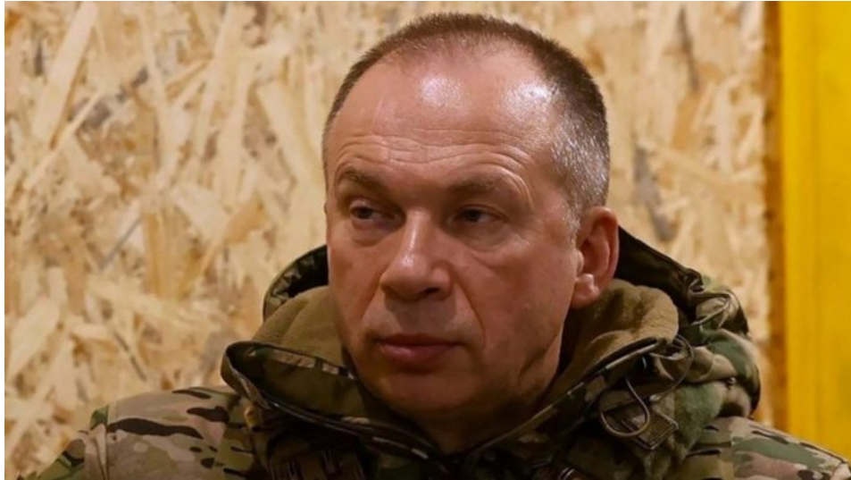
Gen. Alexander Syrský

Agentura TASS poznamenala, že postupující zálohy ukrajinských vojsk na území Sumské oblasti jsou zasahovány ruským letectvem. Je naprosto už jasné, že Kyjev se pokouší o Ardenský zázrak, tedy o vytvoření silné vyjednávací pozice. To byl koneckonců plán Wehrmachtu na konci II. sv. války, kdy německé velení se snažilo v Ardenách dosáhnout co nejlepší a nejsilnější vyjednávací pozice před naprosto jistým koncem války.