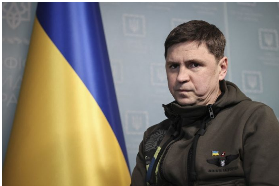
Mychajlo Podoljak, poradce Zelenského a vedoucí jeho kanceláře

S jeho názorem ale němečtí novináři příliš nesouhlasí, protože ochota Ukrajinců pokračovat ve válce je na historicky nejnižším minimu za celou dobu války. Ovšem znovu je potřeba si všimnout, že takový výrok od Podoljaka zazněl historicky úplně poprvé. Nikdy v minulosti nepřicházelo v úvahu, aby řekl nahlas myšlenku, že o územní celistvosti anebo rozdělení Ukrajiny se bude rozhodovat v referendu.