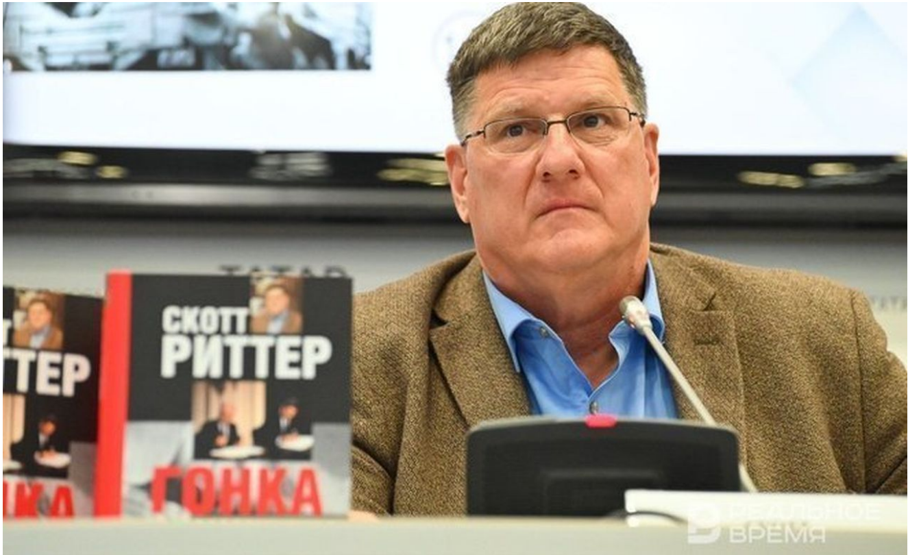
Scott Ritter představil ruský překlad své knihy

Protiruská hysterie se totiž v USA začíná opět a znovu stupňovat spolu s nadcházejícími volbami amerického prezidenta a Deep State opět bude chtít na Trumpa a protiválečné aktivisty vytáhnout tzv. ruskou stopu s obviněním, že Rusko jim zaplatilo peníze, aby manipulovali míněním Američanů před volbami. Tento útok na Rittera není náhodný a je dokonale načasovaný spolu s nejméně aktivní fází americké předvolební kampaně.