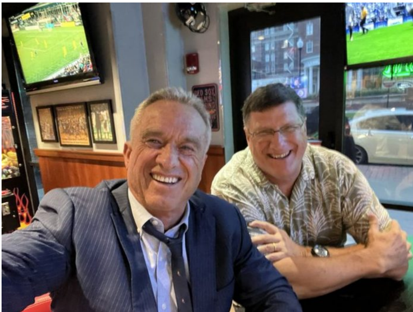
Robert F. Kennedy Jr. a Scott Ritter

Ten byl v sále soudu v Albany na slyšení, zda má být jako nezávislý prezidentský kandidát na listopadových volbách v New Yorku, uvedl list Times Union. Ritterova podpora Kennedymu, který podle pozorovatelů ohrožuje volební šance Kamaly Harris daleko více než preference Donalda Trumpa , byla zřejmě poslední kapkou pro Deep State, a proto hned následující den přišla razie FBI na zastrašení Rittera od dalšího aktivismu.