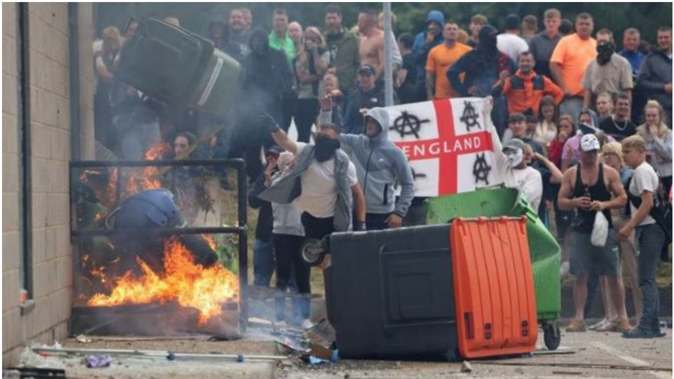
Nepokoje ve Velké Británii

Američané již nekontrolují bojové operace Kyjeva. V této chvíli všechno řídí Londýn, který navíc čelí obrovským nepokojům a lidovému povstání proti migrantům a zejména islamistům v zemi, které vypukly poté, co mladík afrického původu po rodičích ubodal 3 malé dívky. Britský režim teď od počátku týdne začal zavírat lidi za videa z demonstrací proti vládě, britská vláda čelí povstání vlastního britského lidu, a jediná cesta, jak odvést pozornost od povstání, je vyvolání války s Ruskem, a to za pomoci Ukrajiny, která dostala povel vrhnout veškeré své zbytky sil do Kurské oblasti.