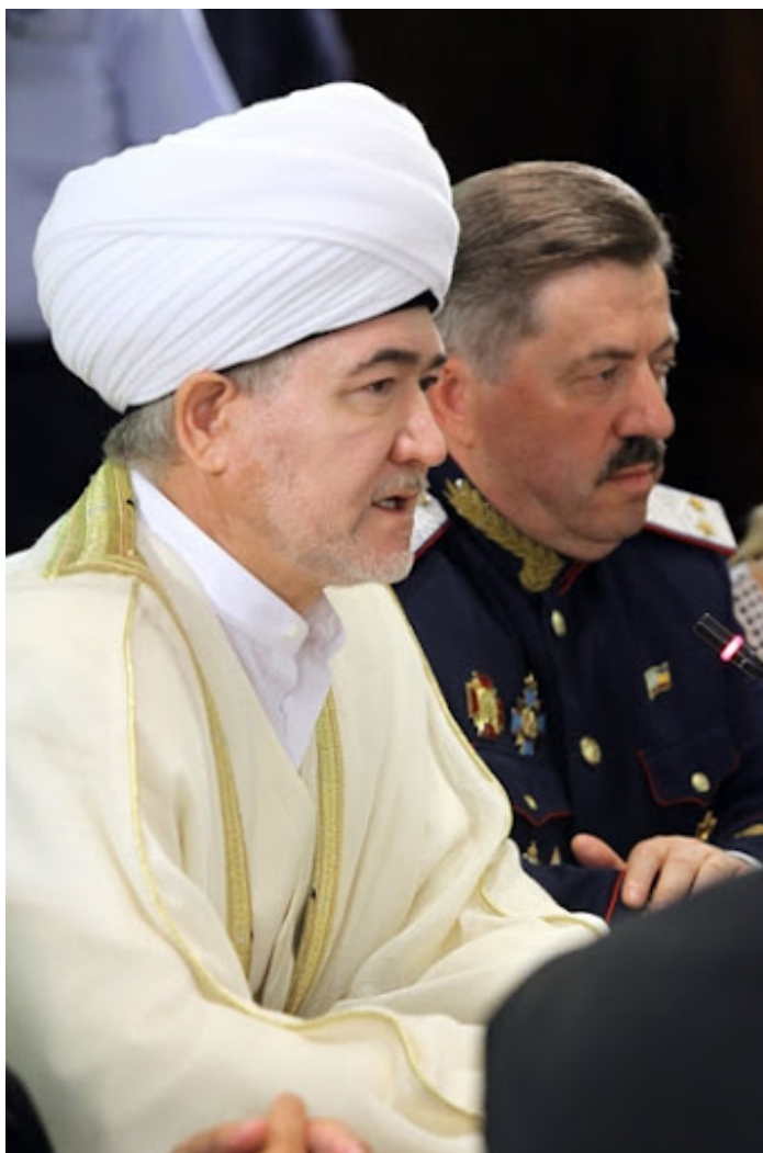
Člen Putinovy prezidentské rady kozácký Ataman Vodolatskij, (vpravo), potvrdil, že každý nově registrovaný kozák dostane od Putina novou půdu na Záporoží.