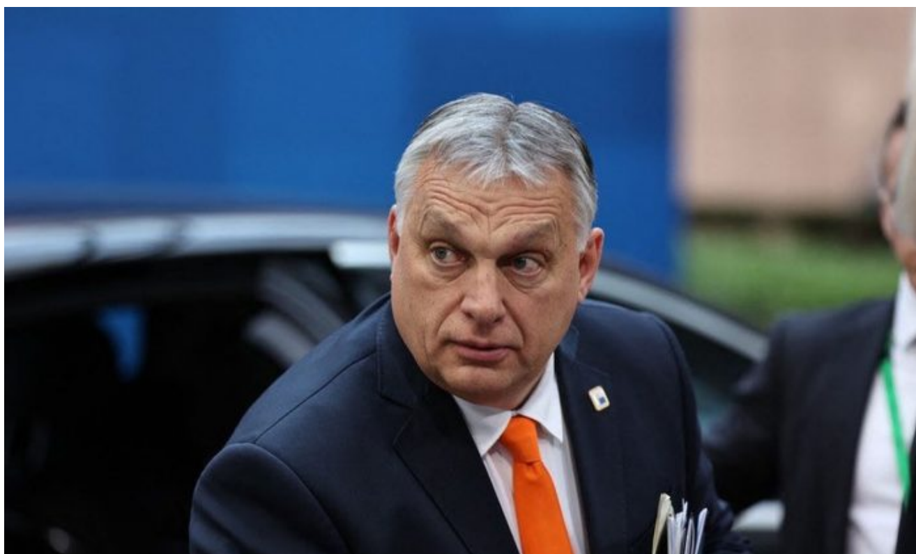
Viktor Orbán, maďarský premiér

Stojí za tím pohrobci německých nacistů, kteří nyní stojí v čele tzv. Deep State v USA. Právě oni před pár dny rozhodli [1], že USA nasunou v roce 2026 do okupovaných německých regionů americké zbraně dlouhého doletu. Slovensko a Maďarsko však oficiálně nejsou okupovanými zeměmi a proti agresi USA skrze Ukrajinu ve formě zablokování dodávek od smluvní strany v Rusku je potřeba využít nejsilnější diplomatickou cestu, tedy diplomatickou demarši vyzývající k okamžitému ukončení aktu války a projevů agrese proti Slovensku. Není již na co čekat, Roberte!