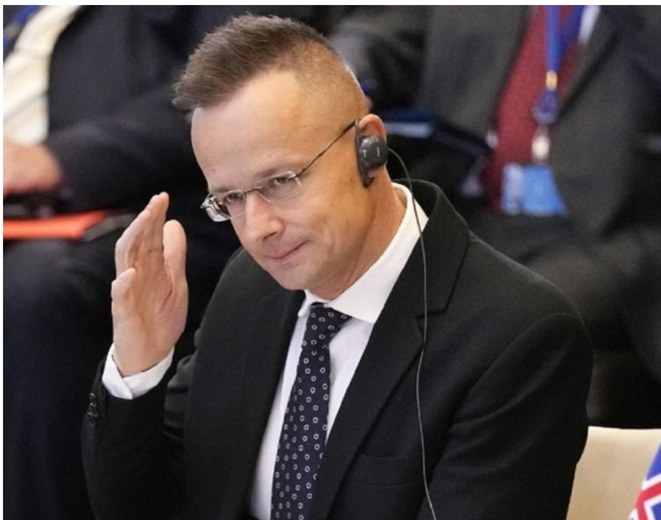
Péter Szijjártó, maďarský ministr zahraničí

A že situace eskaluje, to dosvědčuje pondělní výrok maďarského ministra zahraničí. Péter Szijjártó prohlásil [2], že Budapešť považuje rozhodnutí Kyjeva zastavit tranzit ropy za nepřátelské, zejména s ohledem na dovoz elektřiny z Maďarska na Ukrajinu. Dodal také, že pokud Ukrajina tranzit neobnoví, “Evropa bude mít právo neuplatňovat ustanovení asociační dohody s EU”. Péter Szijjártó uvedl, že Maďarsko a Slovensko zahájily konzultace s Evropskou komisí před zahájením řízení proti Ukrajině kvůli zastavení tranzitu ropy z Ruska. Prostě znovu zde vidíme Fialenkův syndrom.