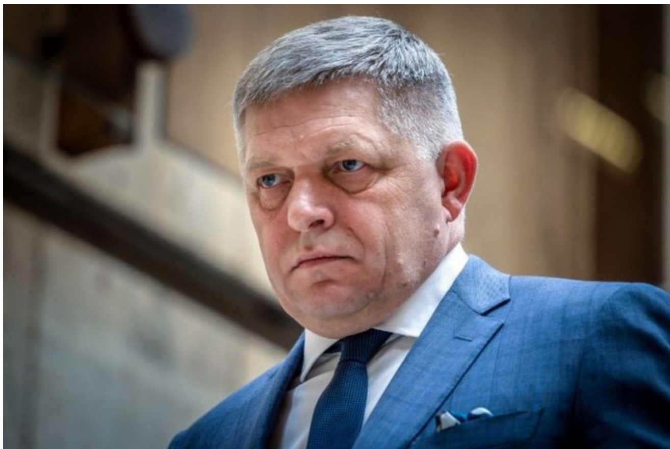
Robert Fico, slovenský premiér

Doporučil bych Robertu Ficovi aby jeho vláda zaslala Kyjevu ostrou demarší o zaznamenání nepřátelského aktu vůči Slovensku v souvislosti se svévolným zablokováním dodávek strategické suroviny do členské země EU od smluvního ruského partnera. Slovensko přitom stejně jako Maďarsko dodává na Ukrajinu elektřinu a od soukromých slovenských zbrojovek dokonce zbraně a munici. A Ukrajina se tako odvděčí?