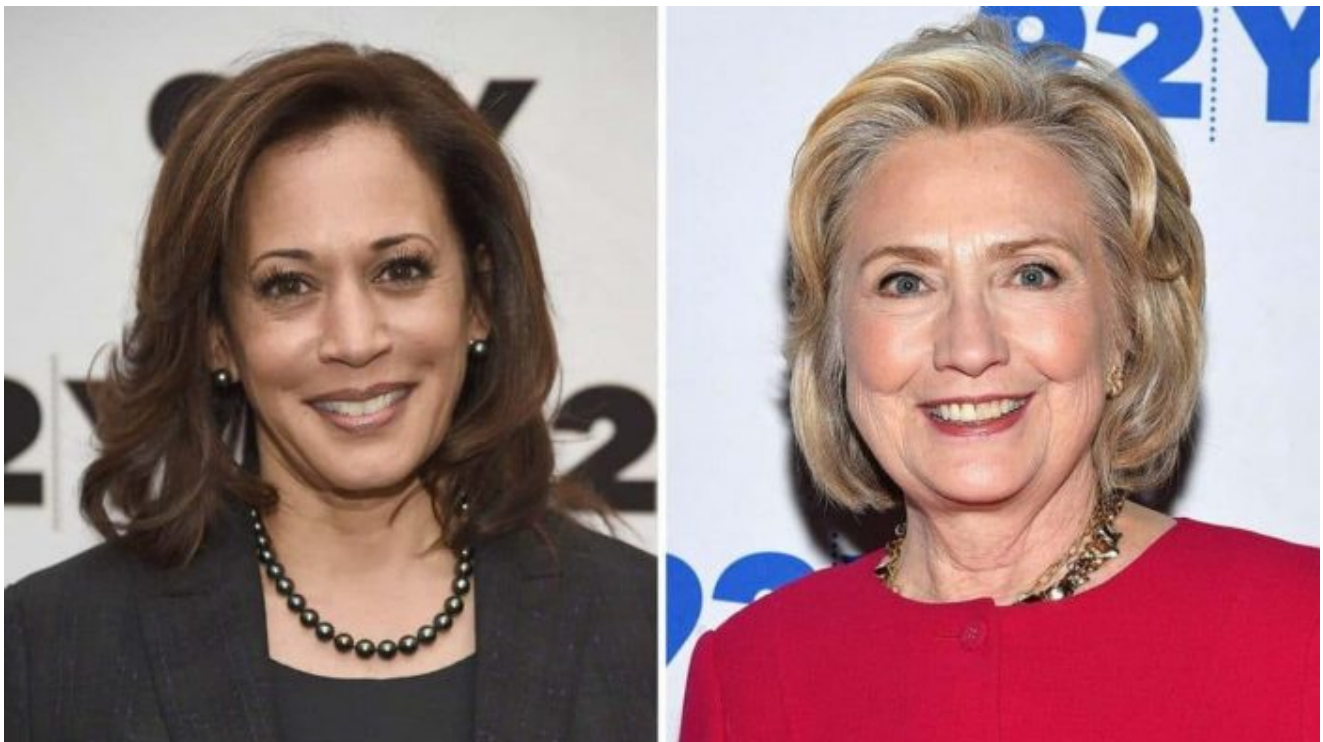
Kamala Harris a Hillary Clinton

A to je právě ten problém. Aby to mohlo fungovat, musela by Hillary být jedničkou jako kandidátka na prezidentku, zatímco Kamala by znovu a již podruhé kandidovala na viceprezidentku. Hillary by do role viceprezidentky totiž rozhodně nešla. Je totiž maximálně ambiciózní, a pokud by do toho šla, chtěla by odvetu za rok 2016.