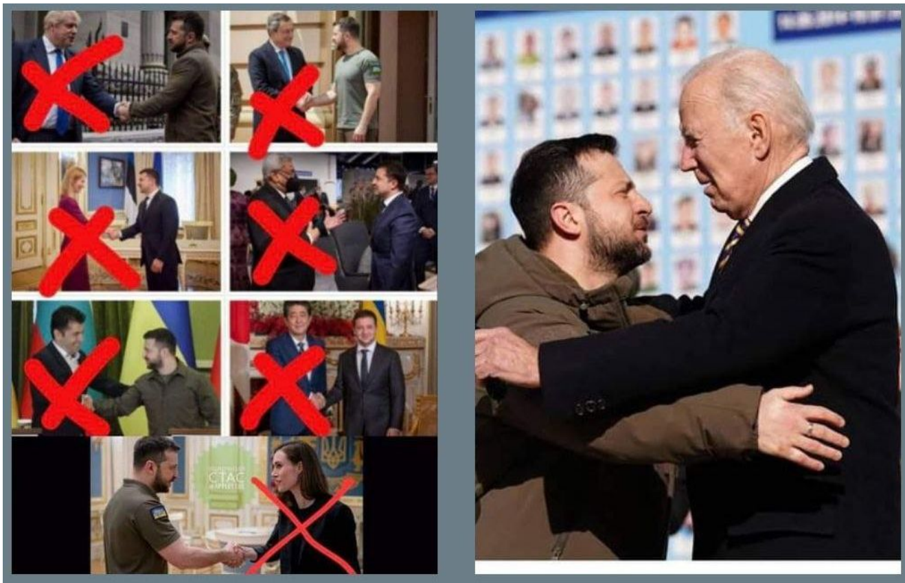
Oběti Zelenského kletby

i když ona to podle informací nechtěla, protože pomazání od Joea Bidena působí v této situaci jako stigma a polibek smrti. Podobně jako obětí od Ňuchačenka.