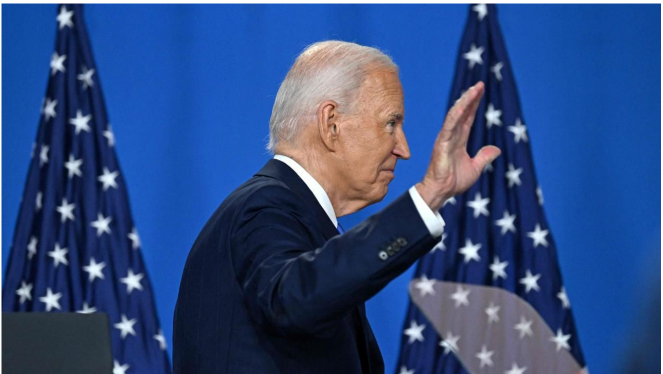
Joe Biden oznámil ukončení volební kampaně

A to z důvodu, že Joe Biden ztratil důvěru a podporu dárců a sponzorů Demokratické strany, kteří před 2 týdny zastavili veškeré finance a příspěvky do volební kampaně s ultimátem, že pokud Joe Biden z kampaně nedostoupí, nepošlou už ani dolar. A americké volby se bez peněz donátorů prostě dělat nedají. Proti penězům se nejde postavit, a ani americký prezident se nemůže postavit proti síle peněz.