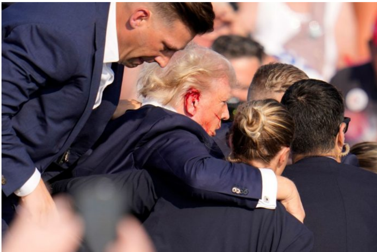
Ochranka odvádí Donalda Trumpa z pódia

Když se okolo něho srotila ochranka, zvedl ruku nad hlavu se zařatou pěstí. Trump nejen přežil atentát, ale právě si asi definitivně zajistil cestu do Bílého domu, protože jako přeživší atentátu se stane žijícím mučedníkem. Jako Robert Fico. Živoucí legenda! Deep State tento atentát naprosto nezvládl, ale není vyloučeno, že nyní dojde ke druhé fázi, tedy k atentátu na Joea Bidena a Deep State z útoku obviní právě Trumpovy příznivce a média začnou šířit narativ, že se jednalo o pomstu Trumpa Bidenovi.