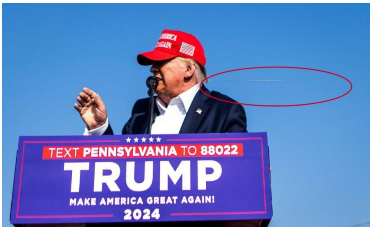
Letící kulka vyfotografovaná fotografem Bílého domu

Střelec Ján Cintula vystřelil na Roberta Fica rovněž pět ran. Jedná se o zajímavou shodu. Ovšem jiná média hlásí, že na Trumpa padlo až 8 výstřelů, ale ty další zazněly až později a není jisté, jestli nešlo o střelbu tajné služby ze střechy, která zastřelila útočníka na protější budově. A pozor, není vyloučeno, že tento atentát na Trumpa má být využit proti Íránu!