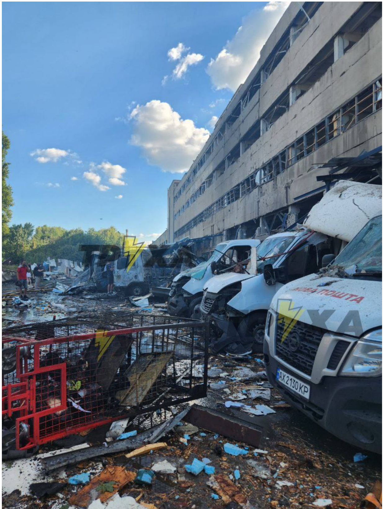
Výsledek přeletu ruské klouzavé bomby FAB 500 do charkovské filiálky Nové pošty.