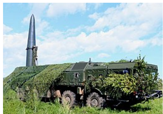
Ruský 9k-720 Iskander-M

Video zachycující zničení M270 MARS, (německá verze US M270 MLRS ATACAMS), krásně ukazuje “tupost” ukrajinské generality, veškerou marnost západní pomoci kyjevskému režimu, i důvody, proč “měkkého” Šojgu nahradil “asketa” Bělousov: