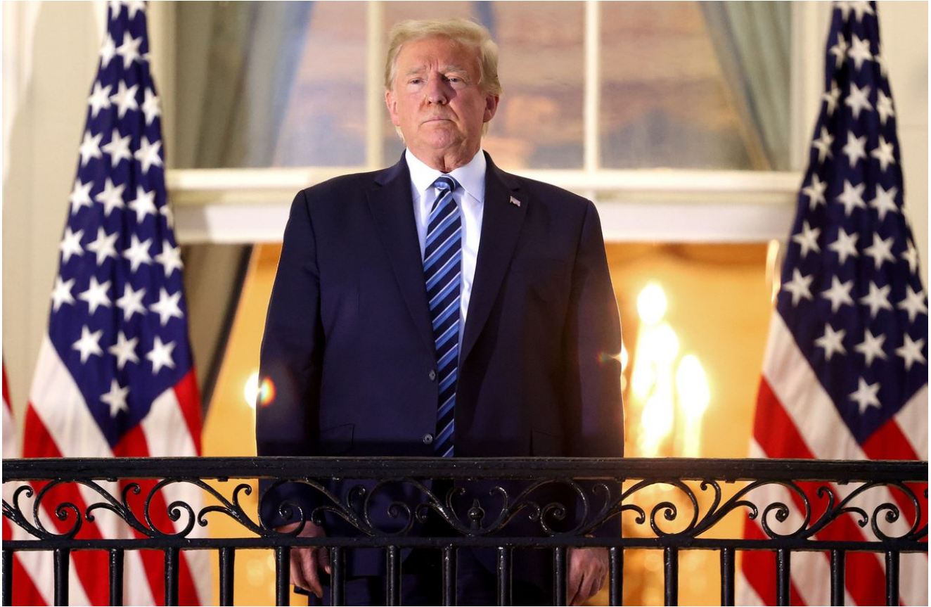
Donald Trump na balkónu Bílého domu

Cesta do Moskvy vyvolala ostré výtky ze strany vedoucích představitelů a úředníků EU, přestože Orbán předtím trval na tom, že Unii nezastupuje. Předsedkyně Evropské komise Ursula von der Leyenová obvinila maďarského premiéra z “appeasementu” ve vztahu k Putinovi. “Pouze jednotu a odhodlání vydláždí cestu ke komplexnímu, spravedlivému a trvalému míru na Ukrajině,” tvrdila.