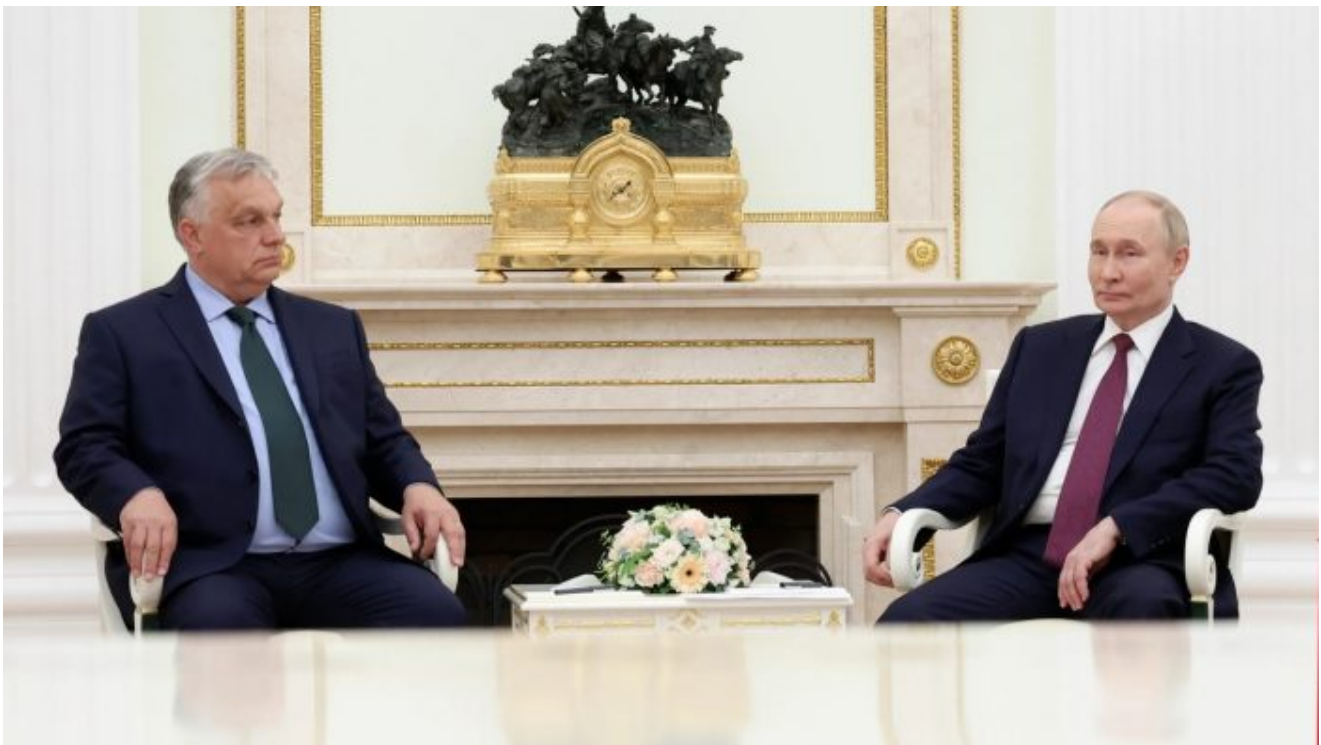
Viktor Orbán s Vladimírem Putinem v Kremlu, 5. června 2024

Kyjev trvá na tom, že pouze vojenské vítězství povede ke “ spravedlivému míru “. Maďarský premiér uvedl, že chtěl přímo od Putina slyšet, jak Rusko vnímá různé mírové iniciativy, a označil to za důležitý krok, přestože upřímná diskuse potvrdila, že mezi znepřátelenými stranami existuje velká roztržka. Putin a Orbán diskutovali o “nejkratším východisku” z konfliktu, což druhý jmenovaný později prozradil novinářům. Pozice Moskvy a Kyjeva zůstávají velmi vzdálené, přiznal Orbán.