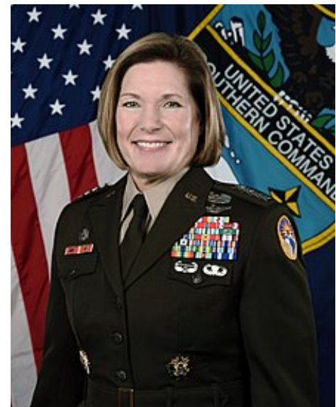
US generálka Laura Richardsonová, velitelka tzv. Bojiště Jižní Amerika přiznala, že čínská expanze v Jižní Americe je proti oprávněným Americkým zájmům!

Washington se letos v dubnu pokusil dokončení přístavu za 3.5 miliardy USD zmařit. Jeho exponenti i rezidenti v zemi nechali soudně zrušit vlastnictví ze 70% dostavěného přístavu čínskou státní společností COSCO, neboť smlouva byla prý před lety uzavřena v rozporu s platnými zákony. 9. května pak v útoku proti přístavu pokračovala i velitelka tzv. Jihoamerického bojiště (Soutcom) US generálka Laura Richardsonová a hřímala na 9. Hemisférické bezpečnostní konferenci, že mega-přístav Chancay, a jemu podobné, které nyní na kontinentu rostou jako houby po dešti, nebezpečně zlepšují přístup Číny k jihoamerickému nerostnému a přírodnímu bohatství na úkor oprávněných amerických zájmů. Podle generálky jihoamerický region z čínského drancování přírodních zdrojů nebude nic mít a současný čínský rozvoj zaostalé jihoamerické infrastruktury je jen zástěrou pro šíření různých alternativ k západní demokracii i lidským právům.