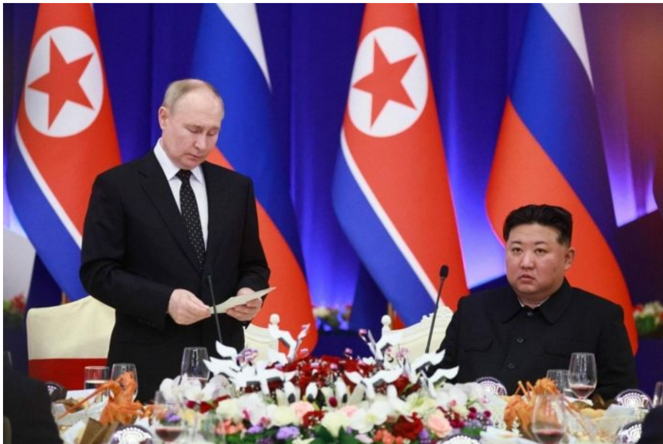
Vladimir Putin a Kim Čong Un na slavnostní večeři

Mluvčí amerického ministerstva obrany to komentoval slovy: “Kdybych byl příslušníkem severokorejské armády, zpochybnil bych moudrost vyslání na Ukrajinu, aby se účastnila nezákonné války ve východní Evropě.” Americká vláda si je vědoma hrozby tzv. rozlití konfliktu z Ukrajiny do zbytku celého světa, minimálně do prostoru Jihovýchodní Asie, kde jsou nyní v ohrožení dva spojenci USA, tedy Taiwan a Jižní Korea.