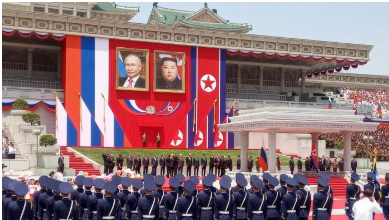
Uvítací ceremoniál Vladimira Putina v Pchjongjangu

První krok udělala Moskva, protože Vladimir Putin je šachista a řídí se pravidlem, že je-li rvačka nevyhnutelná, je třeba udeřit jako první. A podle všeho Moskva je už přesvědčena o tom, že na Ukrajině dojde k přímému střetu Ruské armády s vojsky NATO, takže Kreml byl donucen se na tento střet připravit , podepsal obranný pakt s KILDR a na Ukrajinu přijedou severokorejské jednotky. Jak už jsem napsal v posledních několika článcích, Moskva je už o konfliktu a střetu s NATO přesvědčena, že k němu dojde, takže celá tato věc okolo KILDR je přípravou Ruska na velký konflikt. To je prostě fakt a realita.