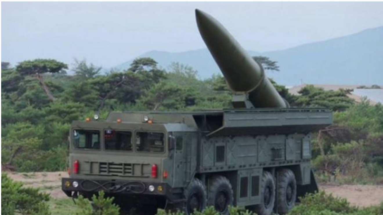
KN-23 Hwasong na odpalovacím komplexu

Jihokorejští představitelé poznamenali, že známky dodávek zbraní a munice ze Severní Koreje do Ruska byly zjištěny již od poloviny loňského roku a dodávky se zvýšily v srpnu před návštěvou severokorejského vůdce Kim Čong-una v Rusku. Kromě toho se objevila tvrzení, že Severní Korea poslala svou nejnovější SRBM, Hwasong-11 (KN-23), na pomoc ruské vojenské kampani na Ukrajině. Mezinárodní experti na zbraně, na které se média odvolávají, uvádějí, že Rusko nasadilo severokorejské rakety SRBM, které se rychle odpalují a skrývají a jsou schopny zasáhnout cíle s vysokou přesností.