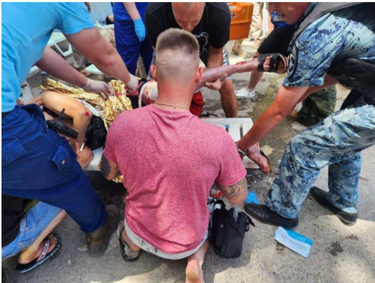
Oběti raketového útoku na pláži v Sevastopolu

Cíle pro ukrajinské rakety ATACMS jsou vybírány na základě údajů z amerických satelitů, uvedlo ruské ministerstvo obrany. Washington prý nese odpovědnost za poslední ukrajinský raketový útok na město Sevastopol na ruském Krymu, uvedlo v neděli ve svém prohlášení ruské ministerstvo obrany. Při útoku raketami ATACMS dodanými USA zahynulo podle úřadů nejméně pět lidí, včetně tří dětí, a více než 120 osob bylo zraněno na pláži, která byla plná rekreatantů.