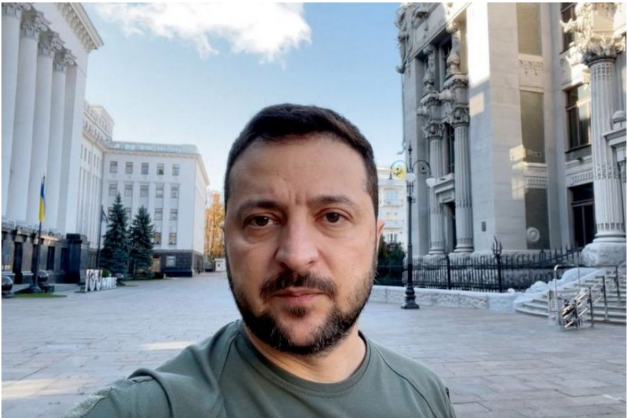
Volodymyr Zelenskyy na Bankové ulici v Kyjevě, kde je sídlo prezidenta Ukrajiny

Padající úlomky její hlavice s kazetovou municí vedly k četným civilním obětem, včetně téměř 30 dětí. “Všechny letové úkoly pro rakety ATACMS zadávají američtí specialisté na základě vlastních údajů americké satelitní rozvědky,” uvedlo ministerstvo obrany. “Proto odpovědnost za záměrný raketový útok na civilní obyvatelstvo v Sevastopolu nese především Washington, který tyto zbraně Ukrajině dodal, a také kyjevský režim, z jehož území byl tento útok proveden.” Ruská armáda dodala, že tyto akce “nezůstanou bez odezvy” . Střelba raket naplněných kazetovou municí je vysoce nebezpečná, protože i při úspěšném sestřelu rakety dojde k disperzi kazetové munice během zásahu střely, takže kazety dopadnou na široké okolí.