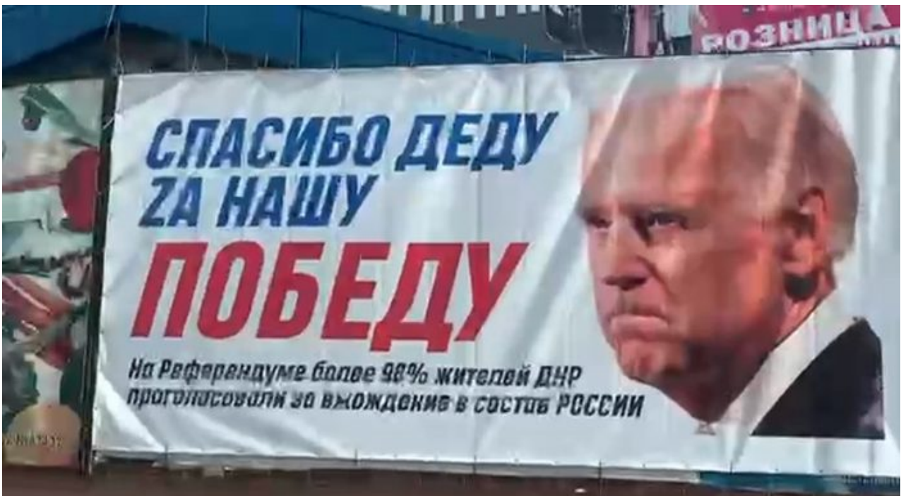
Díky dědovi za naše vítězství – Plakát v Doněcku po referendu o připojení DLR k Rusku

Přesně tohle řekl Alexej Arestovič v rozhovoru, ve kterém působil jako zboží vystavené na krámu, které si je natolik jisté tím, že si ho někdo koupí, že může nasadit cenovku do absurdní výše a ještě si může dovolit nabízet přidané služby, které jsou jinak naprosto nevídané a neslýchané. Pokud totiž kandidujete na Ukrajině na prezidenta, a pokud budete mluvit jako Arestovič, potom bude Ukrajincům jasné, že za vámi stojí síly, které chtějí válku s Ruskem za každou cenu ukončit. Prezidenti jsou vrchní velitelé svých armád, a tudíž jsou důstojníci. Arestovič to připomenul.