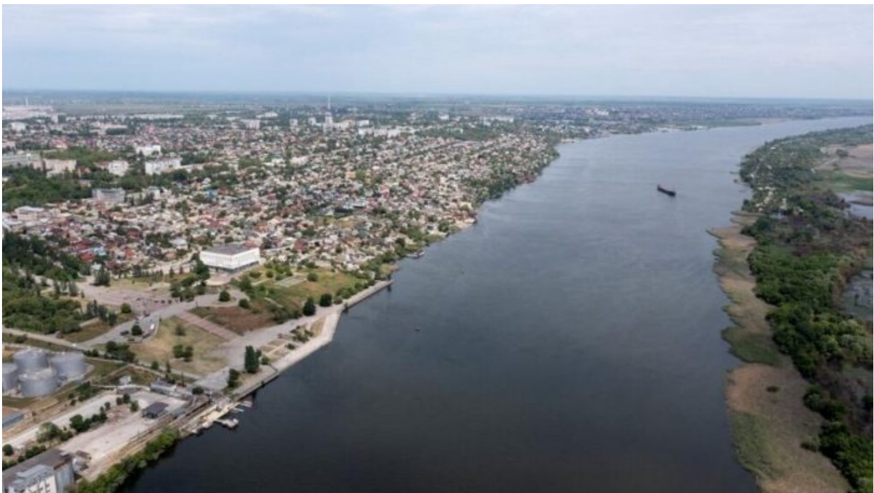
Cherson, rozdělený řekou Dněpr

A díky tomu se podařilo i nastartovat v Rusku válečnou výrobu, Rusko je dnes největším výrobcem vojenských dronů na světě, přičemž ještě v polovině roku 2023 to byla Čína, ale to už neplatí. Ruská válečná výroba běží naplno a Ukrajina už nejen svá ztracená území zpátky nezíská, ale pokud nedojde k mírovému urovnání konfliktu, ztratí ještě další území a další oblasti na Ukrajině. To potvrzují ukrajinské rozvědky, Rusové prý chystají invazi přes řeku Dněpr a opětovné obsazení města Cherson. Podle posledních zpráv z města začala hromadná evakuace státních úřadů, které hromadně začaly pálit všechny spisy, dochází ke kompletní evakuaci ukrajinských úřadů z Chersonu.