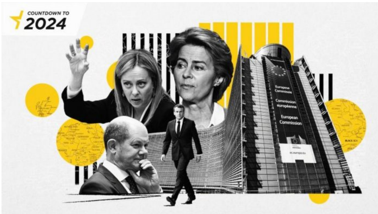
Mogherini, Leyen, Scholz a Macron – Válečný kvartet EU

A to znamená, že Ukrajina buď do konce roku padne, anebo Evropská unie a NATO pošlou Ukrajině na pomoc vlastní vojska . V první etapě by to měli být vojáci, kteří vystřídají na severní hranici s Běloruskem ukrajinské vojáky, kteří tím pádem budou uvolněni a budou se moci přesunout do bojů na frontu. Nasunutí vojáků NATO, i když třeba nakrásně do nebojových misí v hlídkové pohraniční službě na hranici s Běloruskem, povede ke konfliktu mezi Ruskem a NATO. Tomu se nedá vyhnout.