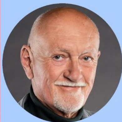
Ing. Hynek Blaško, generálmajor v. v. (nez. europoslanec)