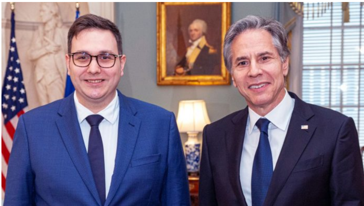
Jan Lipavský a Antony Blinken