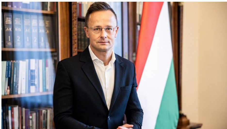
Péter Szijjártó, ministr zahraničí Maďarska

Dal tak najevo, že Maďarsko opravdu začíná v EU vadit a dá se očekávat, že Brusel znovu začne zvažovat, že odebere Maďarsku hlasovací práva, což by se stalo poprvé v historii Evropské unie a vedlo by to zřejmě ke katastrofálním důsledkům ztráty důvěry v demokratické principy EU v mnoha dalších zemích. Evropská branná povinnost je však obyčejnou konceptuální reakcí na realitu pozice Evropy, kdy globalisté i neoconi jsou ochotni pro dosažení svých protichůdných cílů prostě obětovat rozpoutáním III. světového konfliktu na území Evropy. To je bohužel drsná konceptuální realita, která z toho vyplývá.