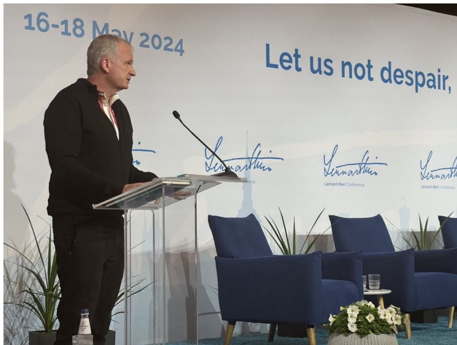
Lennart Meri Conference v Tallinnu s výstižným sloganem: “Nezoufejme, ale konejme!”

V takovém případě by pobaltské státy a Polsko nečekaly na rozmístění ruských vojsk na svých hranicích, varovali pobaltští a polští politici na konferenci, ale vyslali by vojáky na Ukrajinu sami! A co by to znamenalo, bylo jasné: NATO by se stalo účastníkem války. Právě toho se kancléř Scholz a americký prezident oprávněně obávají. Ti, kdo chtějí válku omezit přehnanou zdrženlivostí, podle jedné z analýz, kterou Poláci v Tallinnu prezentovali, ve skutečnosti riskují, že se jim vymkne z rukou. Panečku, to je logika. A právě Polsko by podle informací Spiegelu mohlo být v rámci té koalice vedoucí a velící zemí, pokud by se k akci nepřipojila Francie.