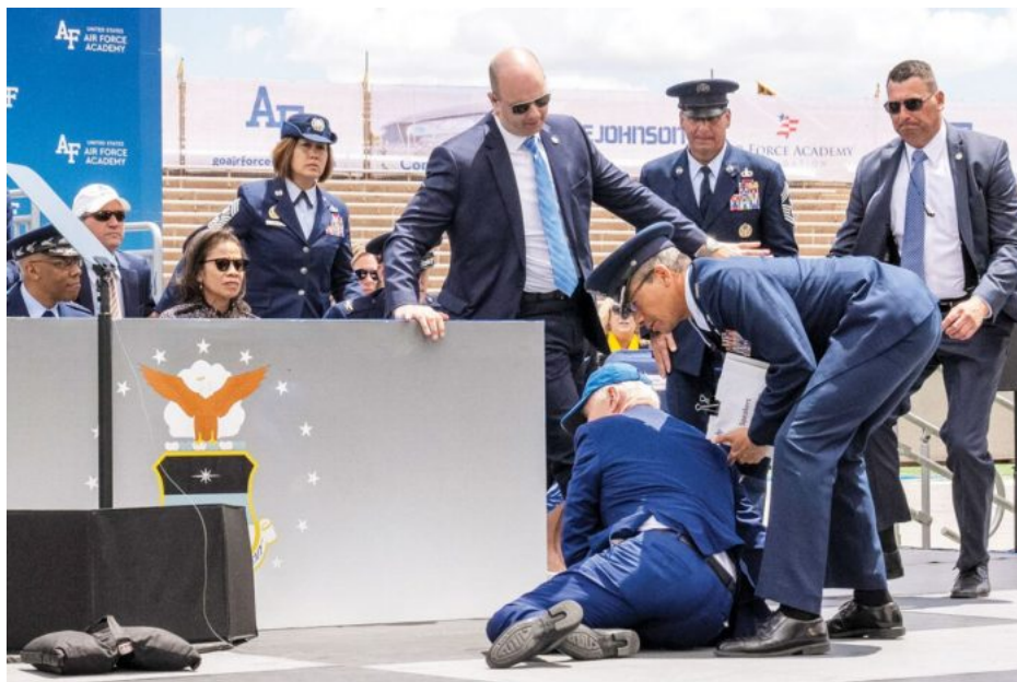
Nástroj globálního prediktora, zbraň na zničení a destrukci systému Pax Americana a pozice USA ve světě

“Nechceme vidět maďarské lidi na frontové linii ukrajinsko-ruské války a nechceme, aby maďarští mladí lidé byli odvedeni na Ukrajinu, protože to není naše válka a my s ní nemáme nic společného.” Země EU se minulý úterý rozhodly použít zisky ze zmrazených aktiv ruské centrální banky na pomoc Ukrajině – především vojenskou. Podle prohlášení Rady EU (složené z ministrů EU) budou peníze použity na podporu ukrajinské armády, posílení ukrajinského obranného průmyslu a obnovu země. Ministr zahraničí uvedl, že na pondělní schůzce jeho kolegové pozitivně hovořili o iniciativě, aby “členské státy NATO sestřelovaly ruské rakety nad Ukrajinou” .