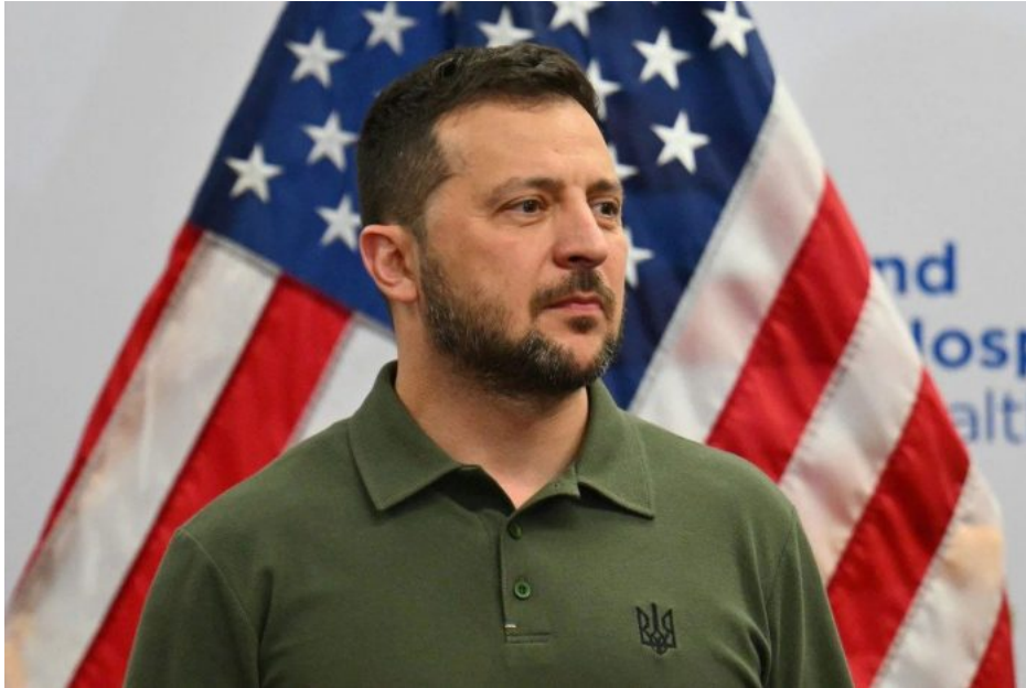
Americký nástroj války proti Rusku, selhávající zbraň amerického vnitřního prediktora proti Rusku

Evropa se mezi těmito dvěma koncepty nachází uprostřed a obě strany jsou ochotny Evropu obětovat, pokud bude dosaženo jejich primárního cíle, tedy zničení USA na jedné straně, či zničení Ruska na straně druhé. Výsledkem tohoto konceptuálního marasmu na ose USA – Evropa – Rusko je nakonec absolutní vítěz, který z tohoto střetu vyjde, a to je Čína!