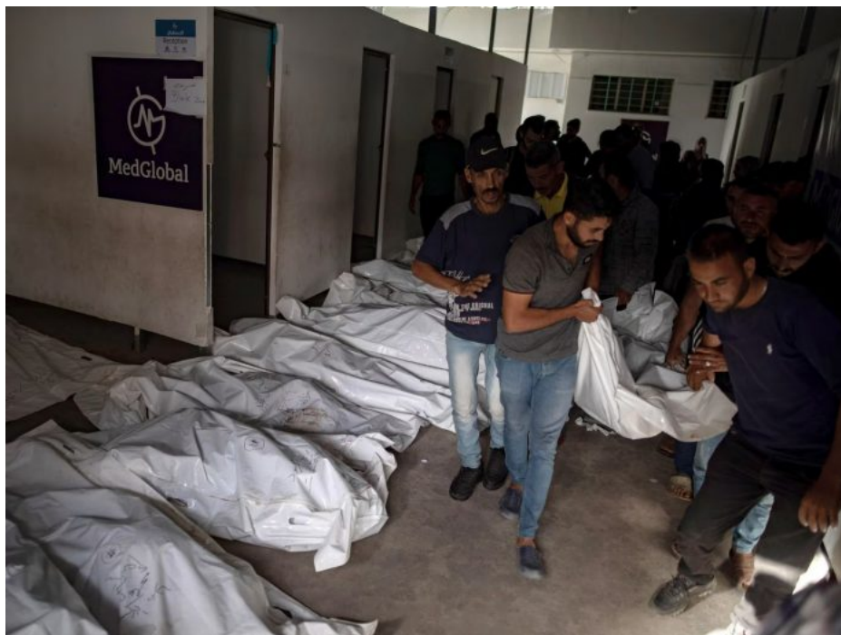
Nemocnice v Rafáhu je zaplněna mrtvolami po izraelském bombardování

Šéf OSN odsoudil izraelské bombardování vysídleneckého tábora v Rafáhu. Antonio Guterres uvedl, že při útoku “zahynuly desítky nevinných civilistů, kteří pouze hledali úkryt před tímto smrtícím konfliktem” . “V Gaze není žádné bezpečné místo. Tato hrůza musí skončit,” dodal Guterres ve svém příspěvku na X.