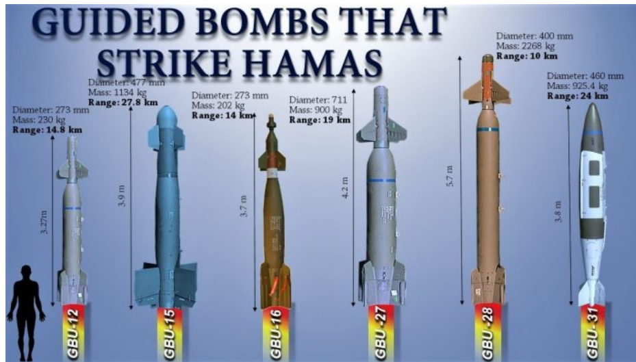
Naváděné bomby (JDAM) používané Izraelem proti Hamásu

Podle popisů těchto svědků by se mohlo jednat o americké protibunkrové naváděné bomby (JDAM), které obsahují speciální směs na bázi ochuzeného uranu. Směs se po zápalu roznětky roztaví na vysokou teplotu a paprsek tohoto materiálu po explozi hlavní nálože má za úkol propálit díru skrze železobeton a potom zapálit vnitřek bunkru.