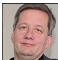
Autor: Zdeněk Koudelka Advokát Více o autorovi ZDE

Na první pohled to vypadá, že válka skončila 8. května. Ovšem není to tak jednoduché. Zarazí již výběr hodiny, těsně před koncem dne.