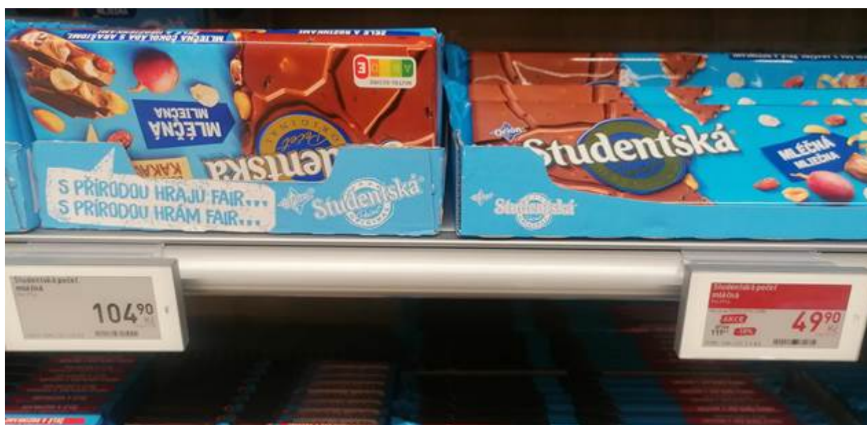
Studentská pečeť v Bille.

Ta výhodná cena v Bille je hlavně proto, že dlouhé čokolády jsou povětšinou zlomené. Což sice neovlivňuje kvalitu, ale esteticky to zrovna není. Proto tedy i takovéto slevy. Dřívější oblíbená pochutina je dnes plná kandovaného ovoce, což jsou další cukry navíc. Nebo karamelu, který je téměř přeslazený.