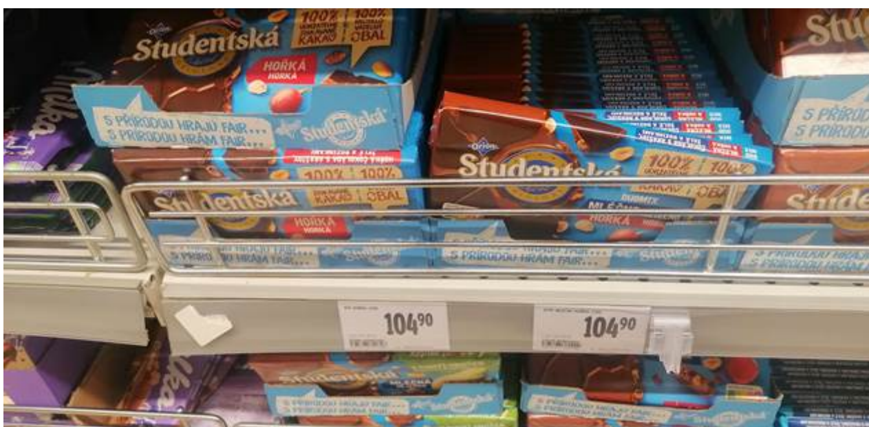
Studentská pečeť v Albertu.

Co supermarket, to v něčem jiná akce. A tak dlouhá tabulka přijde v akci v Bille na neuvěřitelných 49 korun, což je tedy poměrně málo, a oproti tomu bez akce v Albertu je od 105 do 119 korun. Když není akce, máte smůlu, platíte nejvyšší cenu.