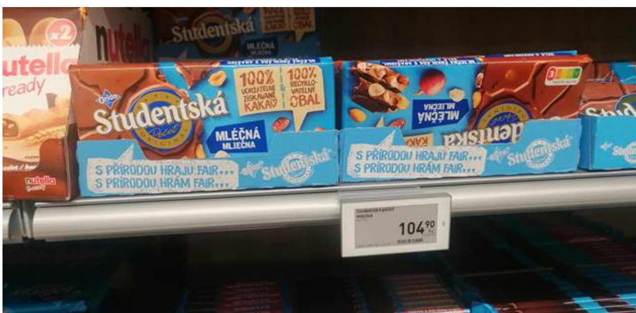
Studentská pečeť v Bille.