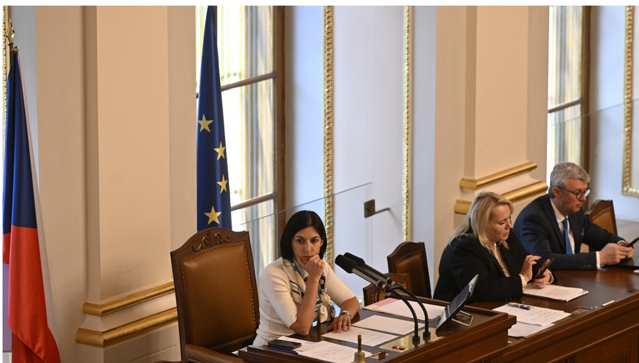
Markéta Pekarová Adamová, Klára Dostálová, Karel Havlíček

Navzdory deklarovaným úsporám a rekordnímu státnímu dluhu si poslanci od roku 2023 opět zvýšili platy. Průměrný plat činil 121 tisíc hrubého měsíčně. Průměrná částka vyplacená na náhradách činila téměř 170 tisíc korun měsíčně. Měřeno poměrem k průměrnému platu se čeští poslanci mají lépe než němečtí zákonodárci. Kverulant.org proti této rozežranosti protestuje. Kverulant kontroluje politiky již od roku 2009. Prosíme kontrolujte je s námi finanční podporou naší práce.